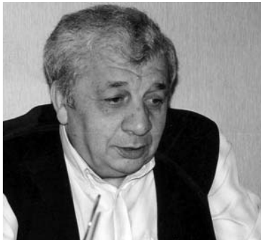
დასასრული. „სბ“ N7-8

გ. გ — და მინც, როგორ მიგანიათ, ერისა და ეთნოსის ასეთი განუყოფლობა უარყოფითი მოვლენა ჩვენთვის თუ დადებითი?