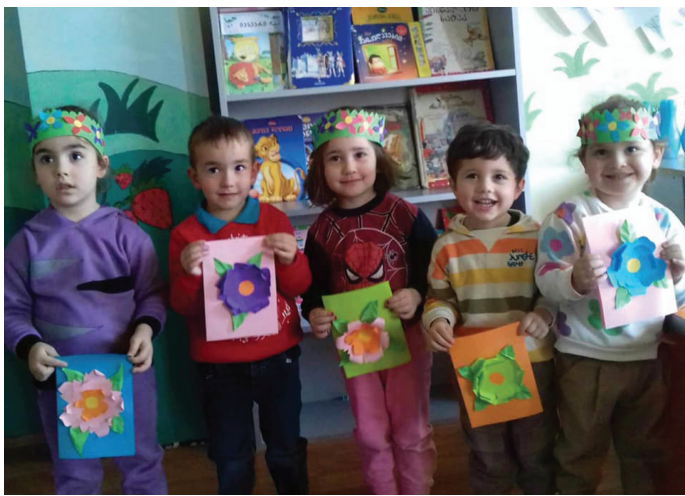
სათვის მიერთმიათ და მიელოცათ 8 მარტი, ჯგუფ „წითელქუდას“ ბავშვებმა კი ყვავილებით „სავესე“ კალათები მიუძღვნეს საყვარელ დედებს.