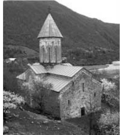
ლარგვისის წმინდა თეოდორე ტირონის სახელობის ეკლესია