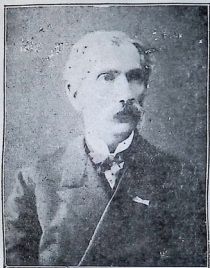
მამა სტეფანესი კონსტანტინე იაკობის ძე ზუბალაშვილი 1829—1901