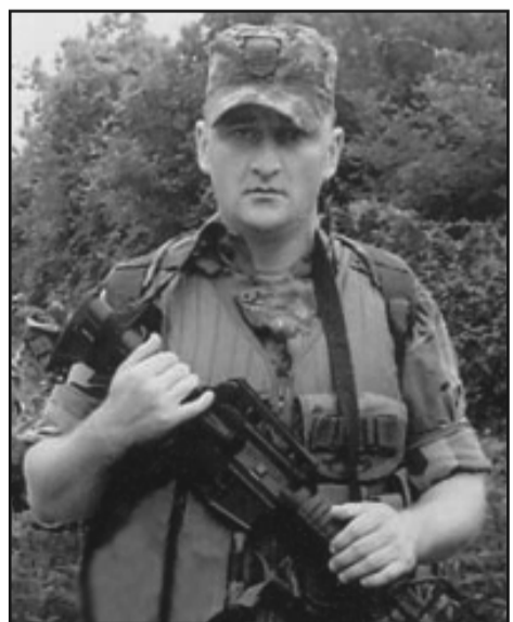
მიანიჭა. თეიმურაზ ბერიძეს მეუღლე და ორი მცირეწლოვანი შვილი დარჩა, მისი გარდაცვალების შემდეგ ოჯახი საცხოვრებლად აჭარაში გადავიდა, სწორედ ოჯახის მოთხოვნით დაღუპული სოფელ ფიროსმანიდან ბათუმში გადასვენეს.

კაპრალი თეიმურაზ ბერიძე 2008 წლის 11 აგვისტოს შინდისში დაიღუპა, იგი საქართველოს პრეზიდენტის 2009 წლის 6 იანვრის N7 განკარგულებით დაჯილდოებულია მედილით „მხედრობის მამაცობისთვის“, მისი სახელის უკვდავსაყოფად კი ბათუმის თვითმმართველობამ 2012 წლის 8 აგვისტოს, მახინჯაურში ერთ-ერთ ქუჩას თეიმურაზ ბერიძის სახელი