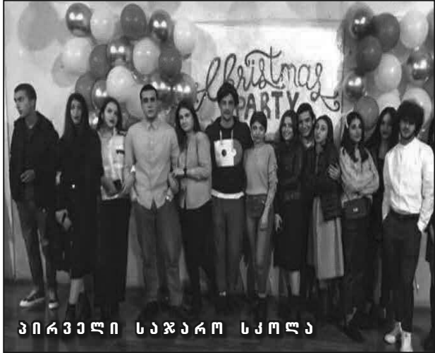
პირველი საჯარო სკოლა

წლებადღეობა, უჩვეულო დისტანციურმა ბოლო ზარმა ყველას დაგვანახა, რომ ყველაფერი ისე არ ხდება, როგორც ვგეგმავთ, თუმცა, ყოველთვის უნდა გვახსოვდეს, რომ ნებისმიერი სირთულე დაძლეადია და მთავარი არა ღონისძიების მასშტაბურობა, არამედ მისი შინაარსი და დატვირთვაა. დიახ, სწორედ ამ განსხვავებული ბოლო ზარის შესახებ დღეს ჩვენს მეთორმეტეკლასელებთან ერთად მათი პედაგოგები, კლასის დამრიგებლები მოგვიყვებიან და გადმოგვცემენ მათ ემოციებს ამ დღესთან დაკავშირებით.