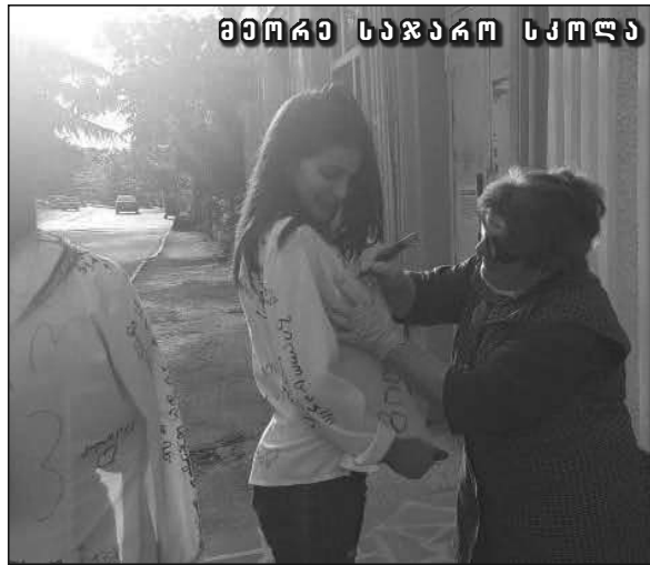
მეორე საჯარო სკოლა

სკოლასაც განსხვავებულ ფორმაში ამთავრებთ. ძალიან თბილები, მეგობრულები, კრეატიულები, საუკეთესოთა შორის საუკეთესო კლასი, ალბათ სიტყვები არ მეყოფა თქვენს დასახაიათებლად, თქვენ მეორე საჯარო სკოლის სიამაყე და დასაყრდენები იყავით, თქვენთან ჩატარებული თითოეული გაკვეთილი დიდი სიამოვნება იყო, ამაში თქვენთან შემომსვლელი ყველა მასწავლებელი დამეთანხმება. კიდევ ერთხელ გილოცავთ, ჩემო კარგებო, წარმატებები იყოს