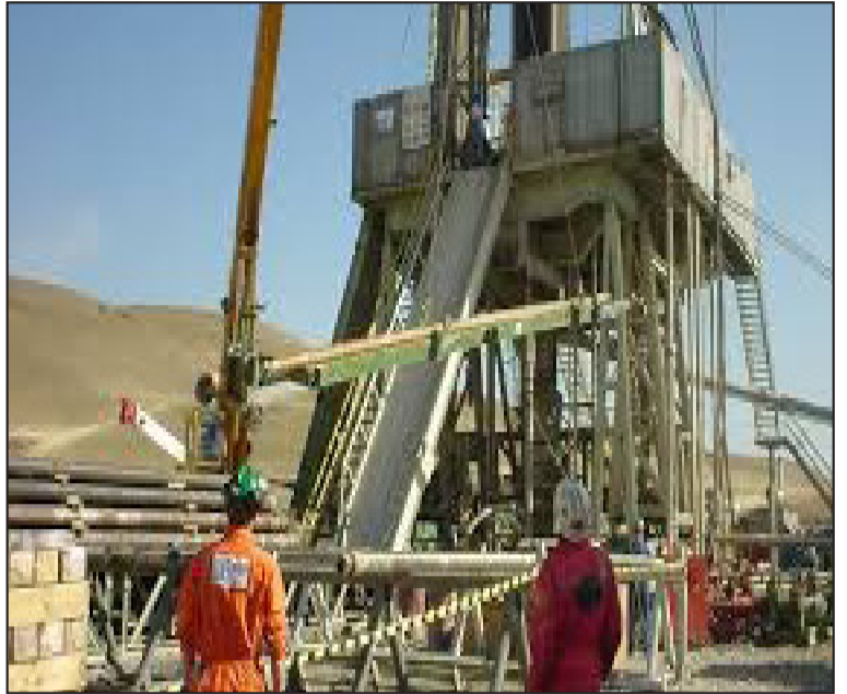
ჯორჯიას“ დედოფლისწყაროელი თანამშრომლებიც მიიღებენ კუთვნილ სახელფასო დავალიანებას.

იმედია, ამ გადაწყვეტილების საფუძველზე „ფრონტიერა ისტერნ