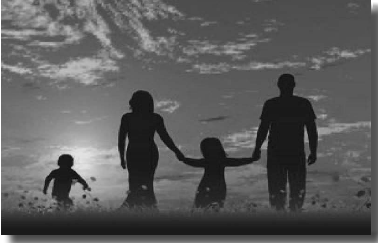
მთელი ცხოვრების მანძილზე. ეს ერთ-ერთი ყველაზე თვისობრივი ფაქტორია ოჯახში მიმდინარე აღზრდის პროცესში.

ალზრდის პროცესში თანდათანობით, ეტაპობრივად აუხსნიან და შეაჩვენებენ შვილებს სწორი გადაწყვეტილების მიღებისა და შესრულების ფაქტორს, რაც გაუადვილებს მომავალ თაობას მთელი შემდგომი ცხოვრების მანძილზე საკუთარი შესაძლებლობების სწორად შეფასებას და არსებული რესურსების გეგმაზომიერ თუ თადარიგიან გამოყენებას