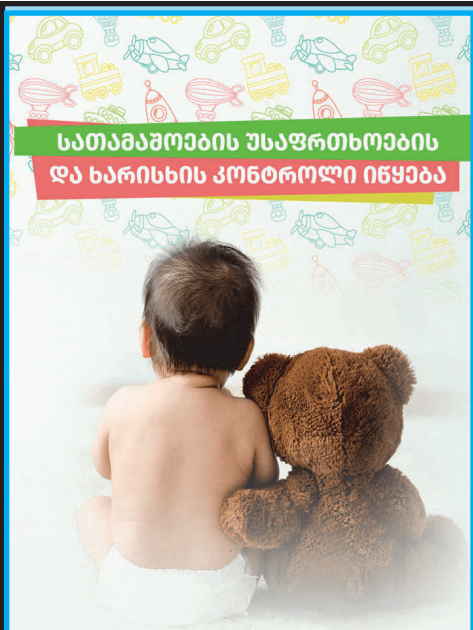
სათამაშოების უსაფრთხოების და ხარისხის კონტროლი იწყება

სათამაშოს ბაზარზე განთავსებამდე, შეფასდება პროდუქტის უსაფრთხოების მოთხოვნებთან შესაბამისობა - იგულისხმება სათამაშოების, როგორც ქიმიური შემადგენლობა, ისე ფიზიკური მახასიათებლები.