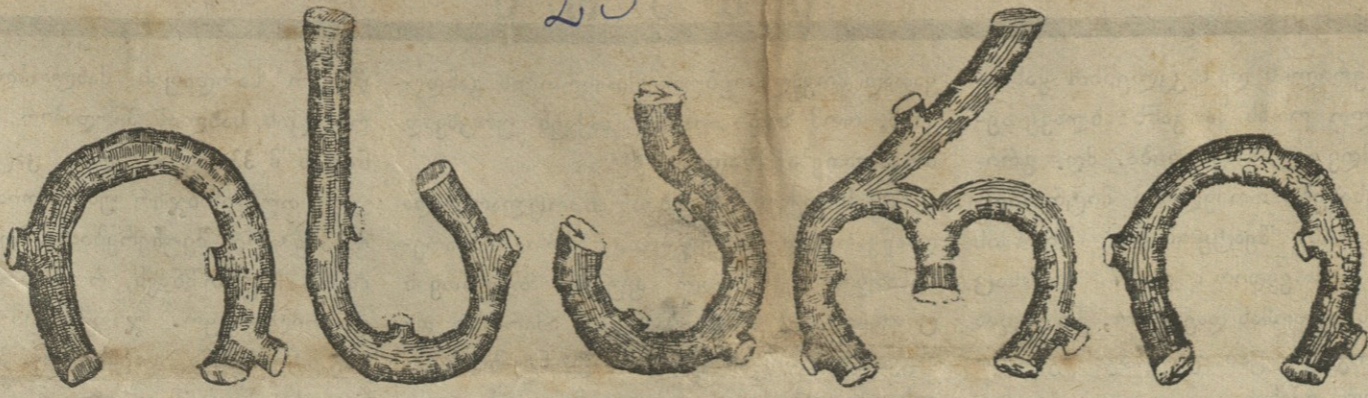
ყოველ დღეში საკოლიტიმო და სალიტერატურო ზაზაში

განთიხარებას გამოწვევა შეიძლება ყოველ თვის პირველ რიცხვიდან. განხილვის დახი: ჩვეულებრივი სტრუქტურის პირველ გვერდზე პერიოდით დღის 15 კ. ჰ. უკანასკ. — 10 კ. ხელის მოწვევა და დასაბუთებელი განხილვის მიხედვით «ისარი»-ს რედაქციასა და კანტონში ყოველ დღე: კვირა-უქმების გარდა, დღის 9 საათიდან ნაშუადღევს 4 საათამდე და საღამოს 5-დან 7-მდე. რედაქციის და კანტონის ადრესი: ელისაბედ. ქ. № 1.