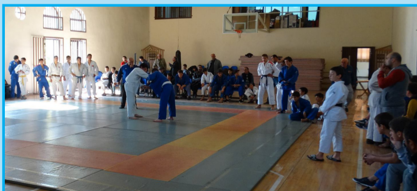
მ 3 . 8

ფეხბურთელი და სისარტყელასფორიანი სამკლავური