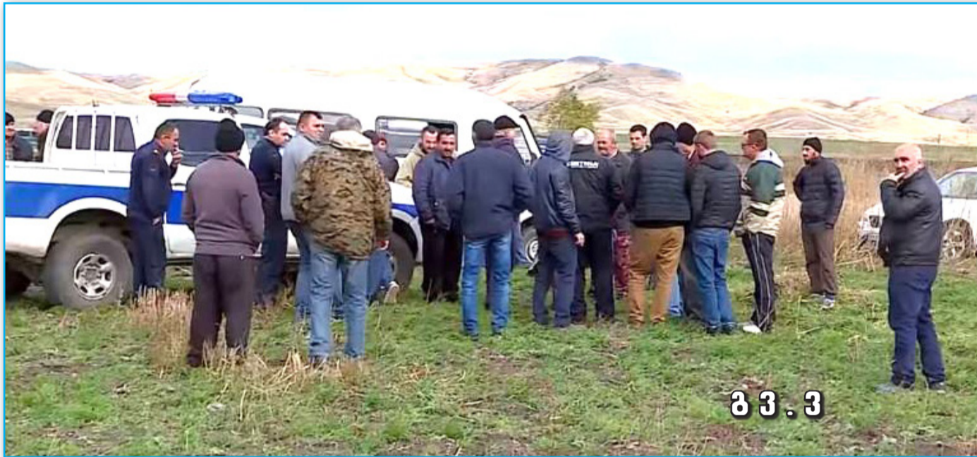
მ 3 . 3