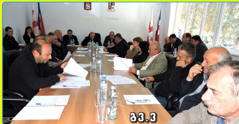
მ 3 . 3