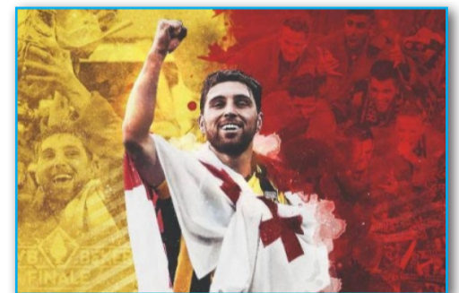
მ 3 . 5

ფეხბურთელი და სისარტყელასფორიანი სამკლავური