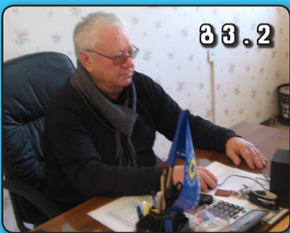
მ 3 . 2