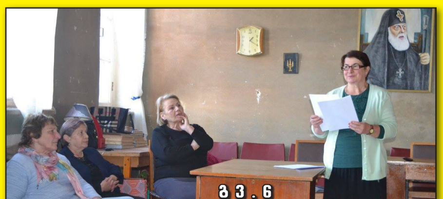
მ 3 . 6