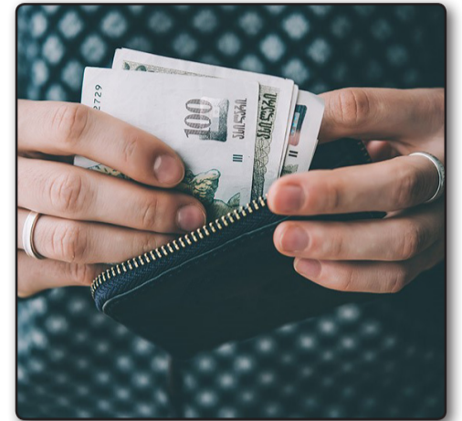
მ 3 . 7