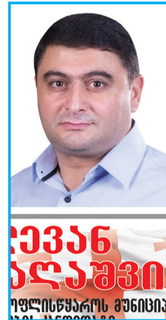
ევანე ხანში დედოფლისწყაროს მუნიციპ. გვ. 3.5