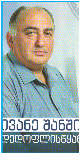
ევანე ხანში დედოფლისწყარ. გვ. 3.5