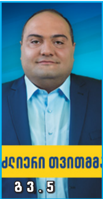
ქლიანი თვითმბ. გვ. 3.5

წარმოგიდგინებთ დედოფლისწყაროს პეროვის კანდიდატებს და მათ წინასწარჩევნო პროგრამას. გაეცანით და გააკეთეთ სწორი, თავისუფალი არჩევანი!