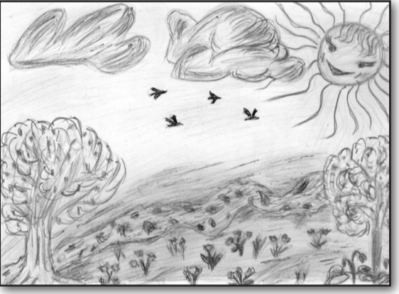
სიცილი, ტირილი, სიკვდილი, სიცოცხლე ადამიანში.

ვიდაცა ჩივის, ვიდაც იციხის, სამეზრო ივსება ადამიანთ. ამიტომ არის არეულობა, დარეულობა,