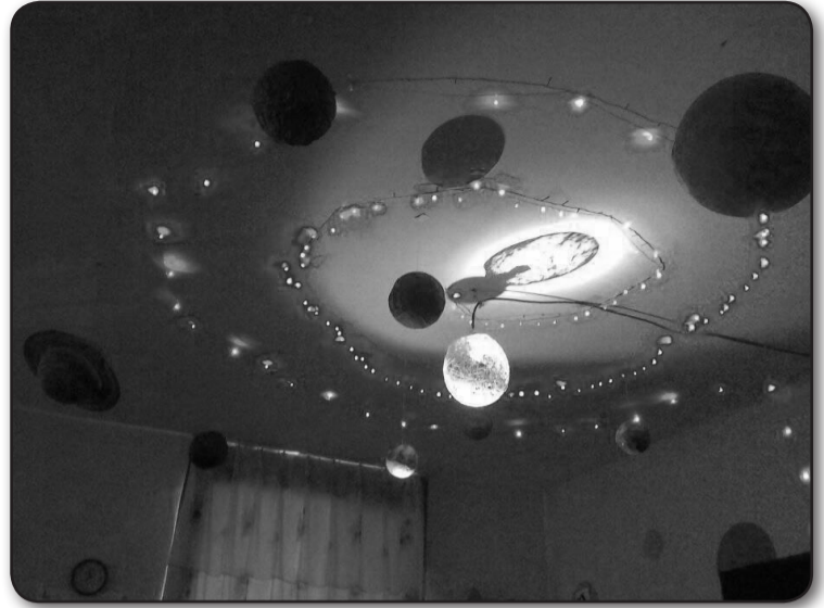
დით ჩვენს ჯგუფში. ხოლო, თუ რა იყო იმ ყუთში, მოგვიანებით გაგიმხელთ...