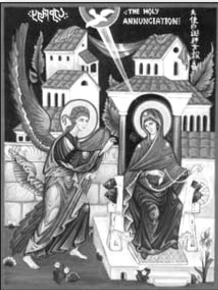
ღვთისმშობელი ქალწული, გისაროდენ, მიმადლებულ მარიამ, უფალი შენთანა, კურთხეულ ხარ შენ დედათა შორის და კურთხეულ არს ნაყოფი მუცლისა შენისა, რამეთუ გაცხობარი გვიშვი სულთა ჩვენთა.

მარიამმა, როცა ყოველივე გამოწვევით გაიგო, დამორჩილდა, მიენდო უფალს და ღვთის ნებას თავისი ნება შეუერთა: „აჰა მხევალი უფლისაი, მეყავნ მე სი-