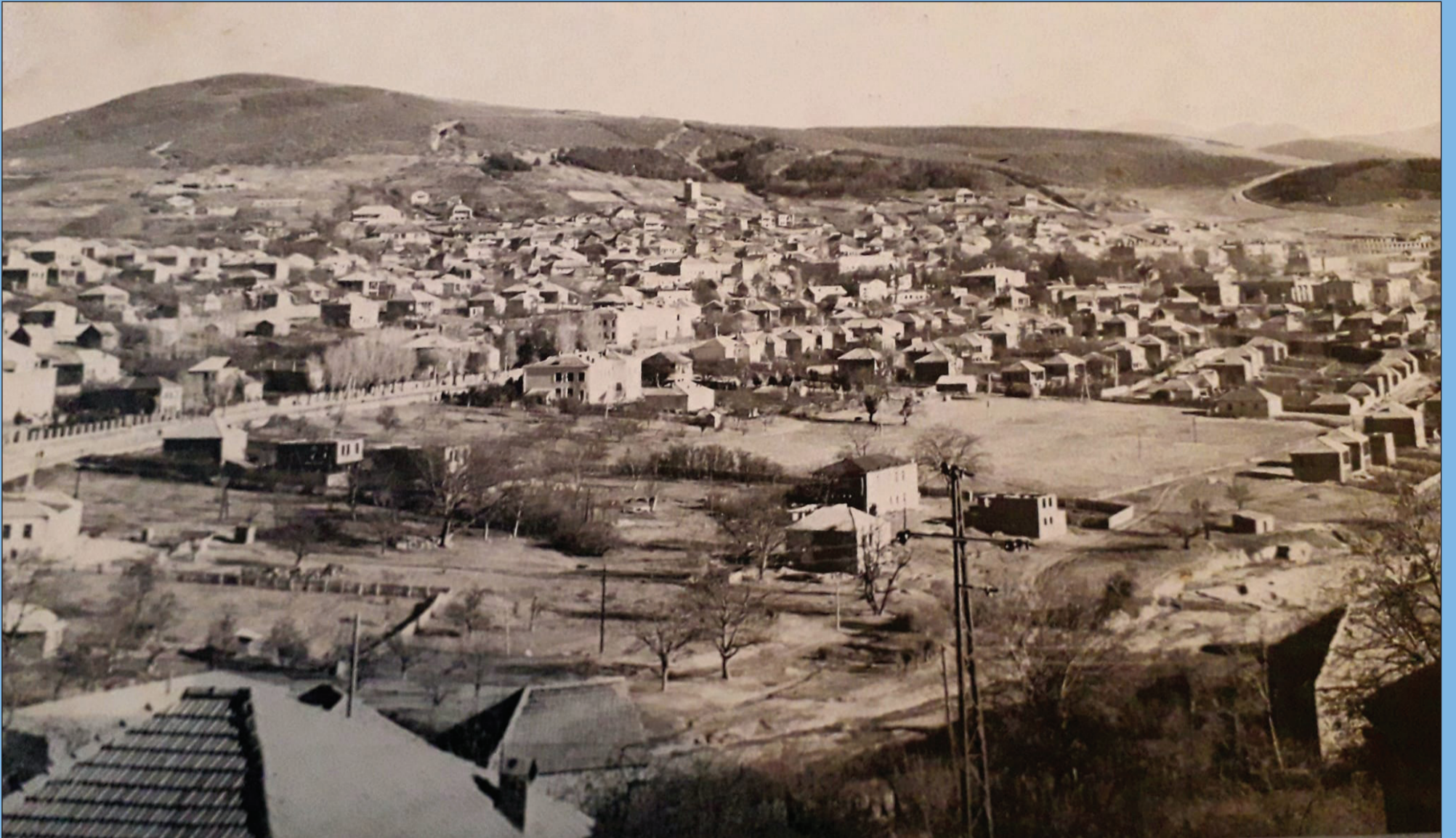
ქ. დუშეთის ხედი. სავარაუდოდ, გასული საუკუნის 50-იანი წლები...