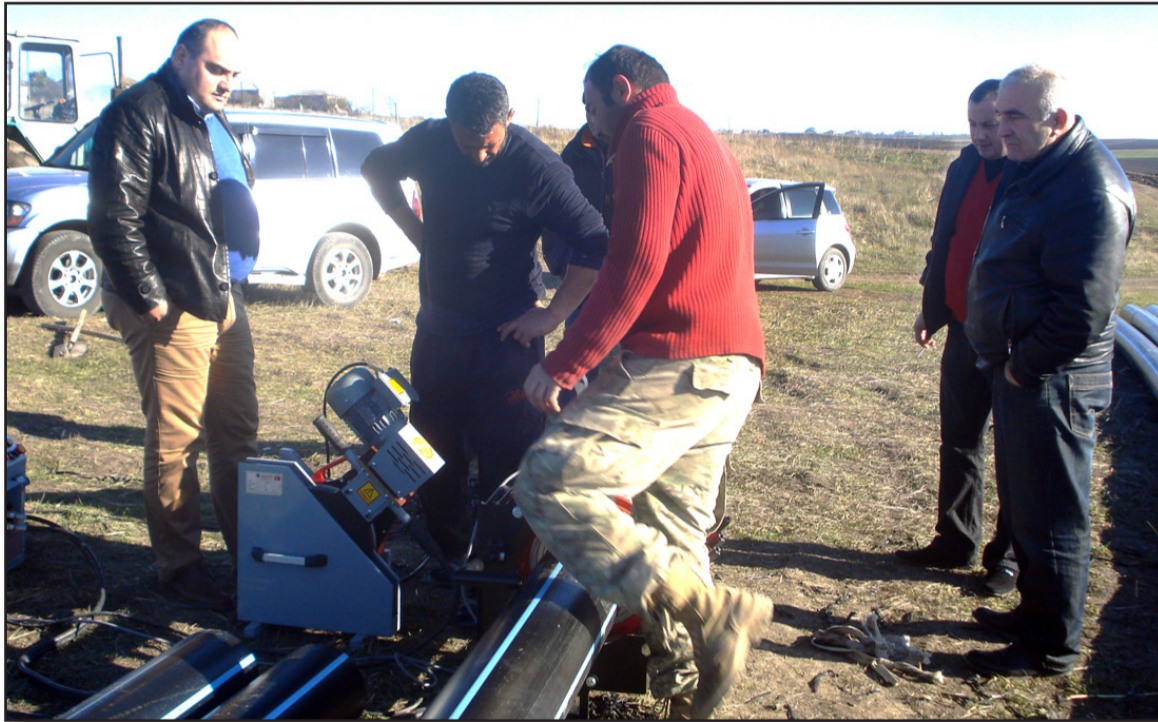
დედოფლისწყაროს მუნიციპალიტეტის სოფლებში, ზემო ქედში, ქვემო ქედსა და გაუფუძვლებების პროცესი მიმდინარეობს. პროექტები წყლის დე-