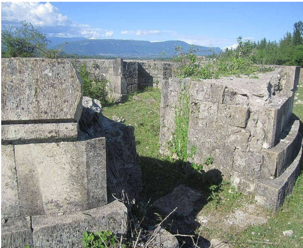
რვააფსიდიანი ტაძარი. X ს-ის დასასრული

დასტურებული მრავალი ისტორიული ძეგლი კვლავაც მოელის არქეოლოგის ბარსა და ნიჩაბს!