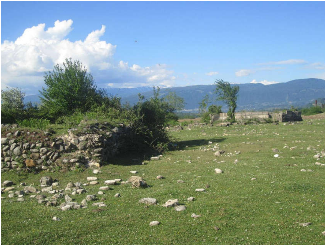
ცხის გალავნისა და რვააფსიდიანი ტაძრის ნაშთი. ხედი სამხრეთ-აღმოსავლეთიდან (ნოჯიხევი).

ბანძის შემოგარენში აღმოჩენილი ძეგლებიდან შეგვიძლია დავასახელოთ სოფლების - ვედიდკარ-მუხურჩის ტერიტორიაზე აკად. ს. ჯანაშიას სახელობის საქართველოს სახელმწიფო მუზეუმის არქეოლოგიური ექსპედიციის მიერ გასული საუკუნის უკანასკნელ მეოთხედში შესწავლილი გვიანი ბრინჯაოს, ადრეული რკინისა და ადრეანტიკური ხანის ნამოსახლარები - „კეკელური ზუგა“ (1974-1976, 1979 წწ.), „ნაჭვიშ ზუგა“ (1981 წ.), „პეტრეს ნაკარუს“ სამაროვანი (1974 წ.) და ე. წ. ნაწისქვიუს ნასოფლარის კულტურული ფენა 64 . ეს არის და ეს! ცხოვრების უძველესი ხანის დამა-