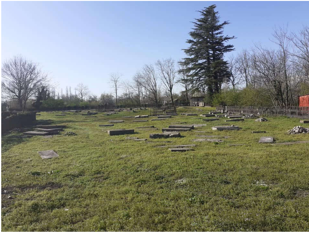
ებრაელთა სასაფლაო ფეთხანის ბანბა

ამასთანავე, გადაუდებელ ამოცანას შეადგენს საფლავის ძველი ქვების დაცვა-შენარჩუნება. სამწუხაროდ, ბანბის ებრაული და ქრისტიანული სასაფლაოების თანამედროვე მდგომარეობის შესწავლას იმ დასკვნამდე მივყავართ, რომ XIX ს-ის დასასრული-სა და XX ს-ის დასაწყისის საფლავის ქვები თითო-ორიოლა თუა შემორჩენილი. სოფლის ებრაულ სასაფლაოზე არის როგორც ძველი ებრაული საფლავის ქვები (მაცევა), ასევე საბჭოთა პერიოდის საფლავებიც, რომლების გარჩევაც ქართული საფლავებისგან ძალიან რთულია. ხშირად ერთადერთი განმასხვავებელი ნიშანი საფლავის ქვებზე ებრაულად დატანებული წარწერებია. სასაფლაო საინტერესოა იმითაც, რომ ის ერთგვარი დამატებითი ისტორიული წყაროა სოფლის ისტორიის შესწავლისთვის. სამწუხაროდ, ახალი საფლავების მეპატრონეებს ზოგიერთი ძველი საფლავის ქვა ნაგავსაყრელზე გადასაგდებად გაუმეტებიათ! თუკი ბანბის საჯარო სკოლაში მსგავსი სიძველეებისა და ცალკეული არქიტექტურული დეტალების, ასევე ძველი ყოფისათვის დამახასიათებელი ეთნოგრაფიული ნივთების განსათავსებლად ერთი