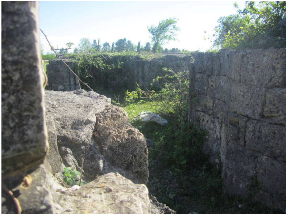
ბანძის (ნოჯიხევის) რვააფსიდიანი ტაძრის ნაშთი. X ს-ის დასასრული

ბანძის „ციხე კეთილნაშენი“ თ. ბერაძემ 1737 წელს შედგენილ ლიხთ-იმერეთის რუკაზე აღნიშნულ „ბანძა-ფადაოს სასახლესთან“ გააიგივა: „ამ პერიოდში დიდი ფეოდალის სასახლე იმავე დროს ციხე-სიმაგრეს წარმოადგენდა. ამიტომ ვახუშტი სწორია, როდესაც ბანძაში ციხეს აღნიშნავს“ 17 .