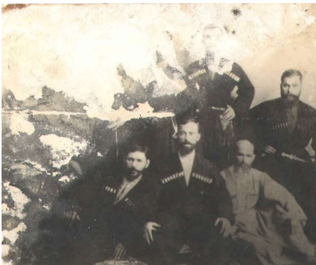
ბანდის ამკრები. XX ს-ის 10-იანი წლები

ბანდაში თანდათან იზრდებოდა სავაჭრო დაწესებულებათა რიცხვი, რასაც ხელს უწყობდა სოფლის მოხერხებული გეოგრაფიული მდებარეობა - აქ თავს იყრიდა სენაკ-ნოქალაქნიდან, ნაოლალენიდან, ჯოლო-აბედათიდან, აბაშა-სუჯუნიდან, ხონი-ლესაინდრედან, სამიქაო-ონოლიიდან მომავალი გზები, რის გამოც ბანკელები ჩაბმულნი იყვნენ სავაჭრო საქონლის არა მხოლოდ ქვეყნის შიგნით, არამედ მსოფლიო-ეკონომიკურ ბრუნვაში. XIX ს-ის ბოლოსა და XX ს-ის დასაწყისში ბაზრის მოედნის ირგვლივ სახელოსნოების, სავაჭროებისა და სამიკიტნოების რიგები იყო გაჭიმული. სოფელში პირველად ჩამოსულს აუცილებლად თვალში ეცემოდა სავაჭრო ფარდულების სიმრავლე.