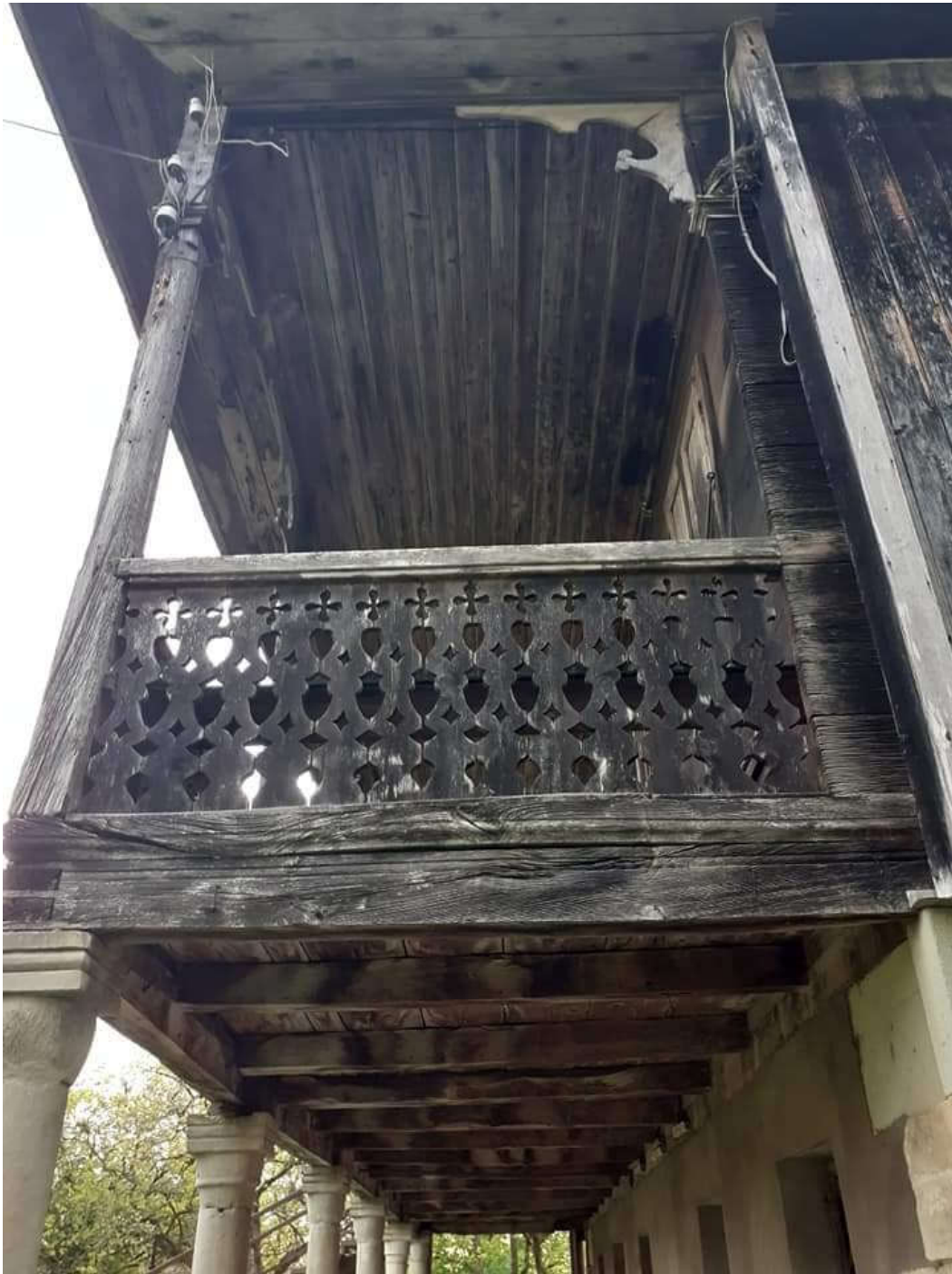
დეკანოზ ანტონ კეკელიას სახლი. XIX ს 80-იანი წლები. ლეკეკელე.