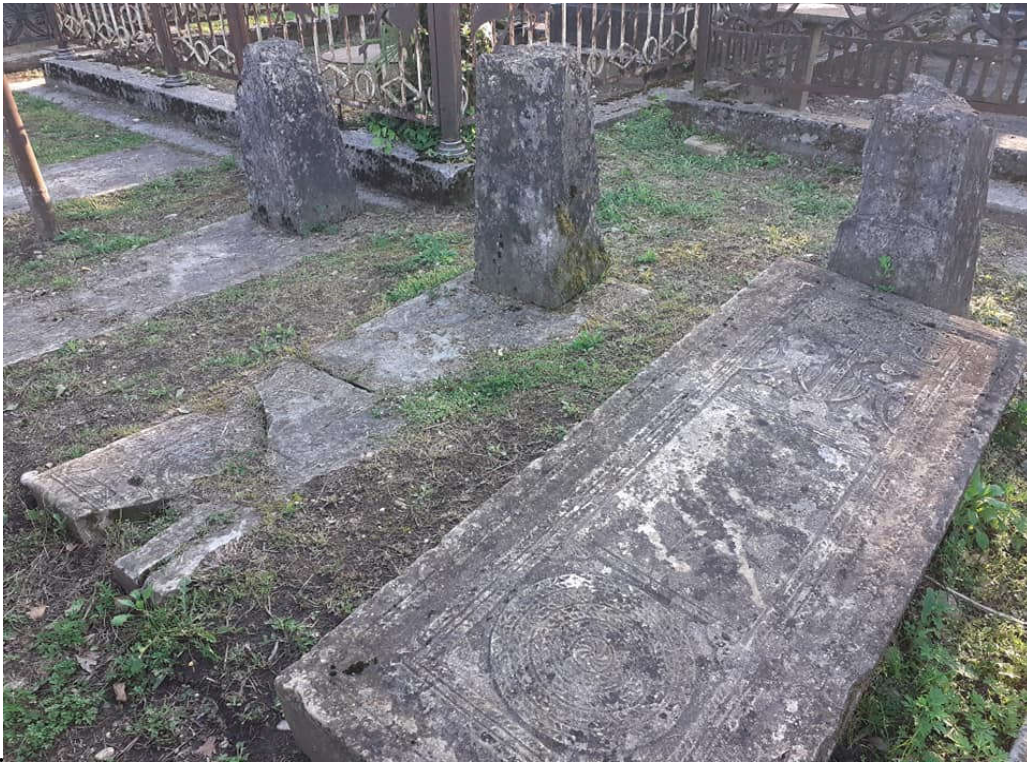
საფლავის ქვები. შაურკარის სასაფლაო. ბანძა. XX ს-ის დასაწყისი.

საკოველთაოდ ცნობილია დიდი ქართველი მეცნიერის, პროფესორ სერგი დანელიას (1888-1963 წწ.) დვაწლი XX საუკუნის ქართული ფილოსოფიური აზრის განვითარების საქმეში. სასურველი და აუცილებელიცაა, მისი ხსოვნის უკვდავყოფის მიზნით სოფელ ბანძაში, მისსავე სახლში, გაიხსნას მემორიალური მუზეუმი, სადაც დამთვალიერებელს შესაძლებლობა მიეცემა, გაეცნოს სახელოვანი მეცნიერისა და საზოგადო მოღვაწის ცხოვრება-მოღვაწეობის ამსახველ მუდმივმოქმედ გამოფენას. ჩვენი მეცადინეობით გარკვეული ნაბიჯები გადაიდგა დანგრევის პირას მისული სახლის აღსადგენად და შესანარჩუნებლად. შეგროვდა პროფ. სერგი დანელიასა და მისი ოჯახის წევრთა პირადი ნივთები, ხელნაწერები, წიგნები და ფოტოსურათები, რაც სავსებით საკმარისია მსგავსი დანიშნულების დაწესებულების დასაფუძნებლად. საჭიროა მარტვილის მუნიციპალიტეტის მერიისა და კულტურისა და ძეგლთა დაცვის სამინისტროს მხრიდან მეტი დაინტერესება და აქტიურობა სახლ-მუზეუმის გასახსნელად. დარწმუნებული ვარ, რომ მსგავსი დაწესებულების მნიშვნელობა მომავალში კიდევ უფრო გაიზრდება და გაფართოვდება. ვფიქრობ, რომ მარტვილის