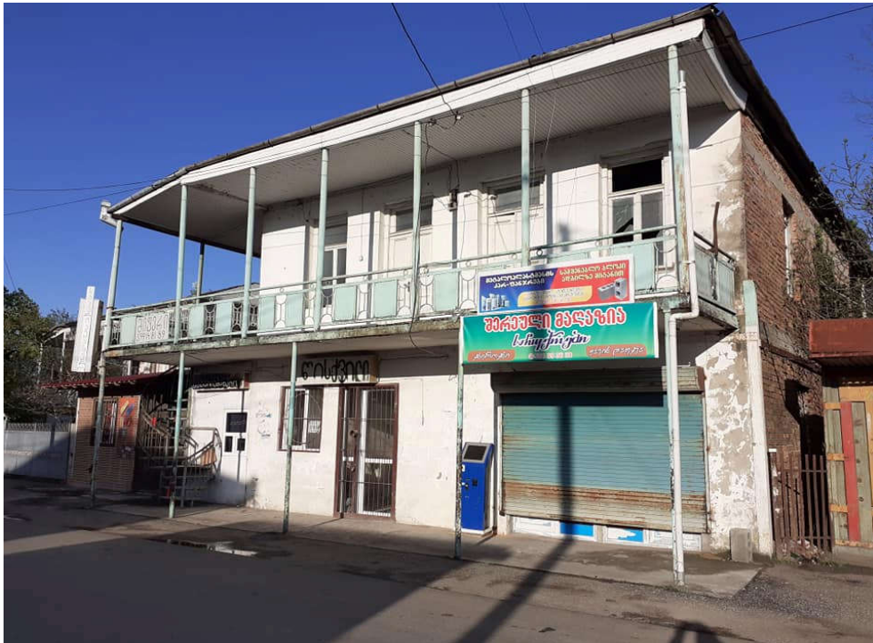
„კატოს დუქანი“. XX ს-ის 10-იანი წლები. ბანძა.