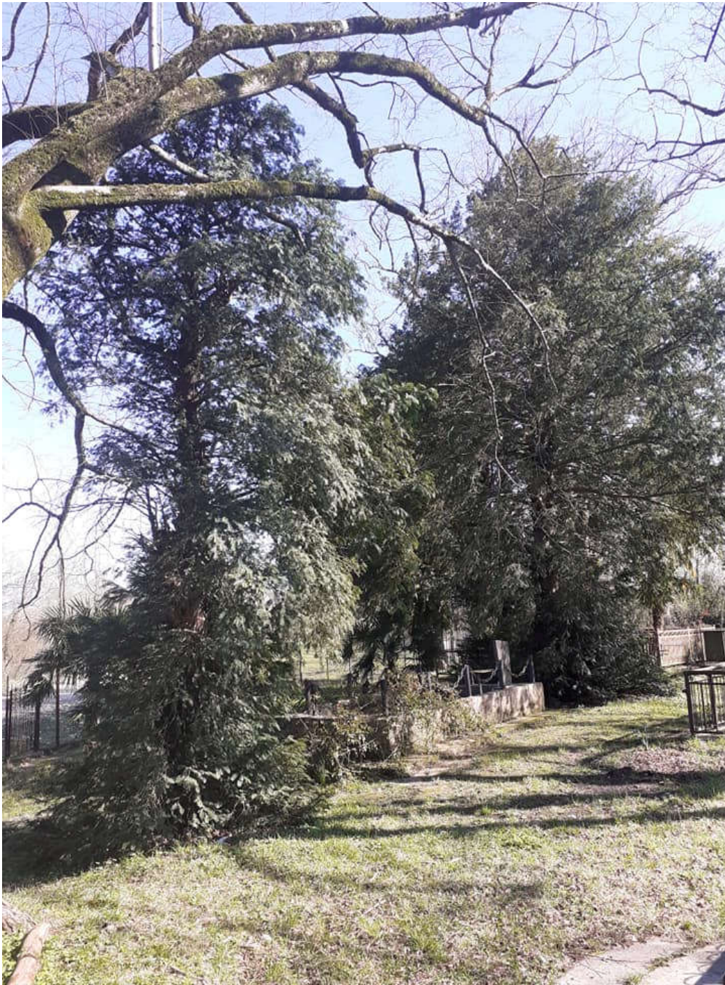
ურთხელის ათასწლოვანი სარიტუალო ხეები „სამოთხე-კარის“ სასაფლაოზე. ლევახანე.

ისტორიის, მისი გარდასული დროის ცოცხალი მოწმეა.