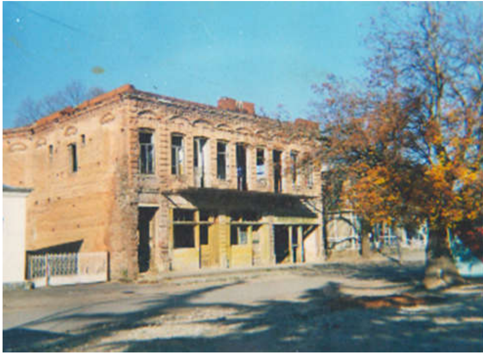
ელა აჯიაშვილის საცხოვრებელი სახლი ურიაკარში. 1913 წ. დაანგრიეს 2003 წელს. ბანძა.