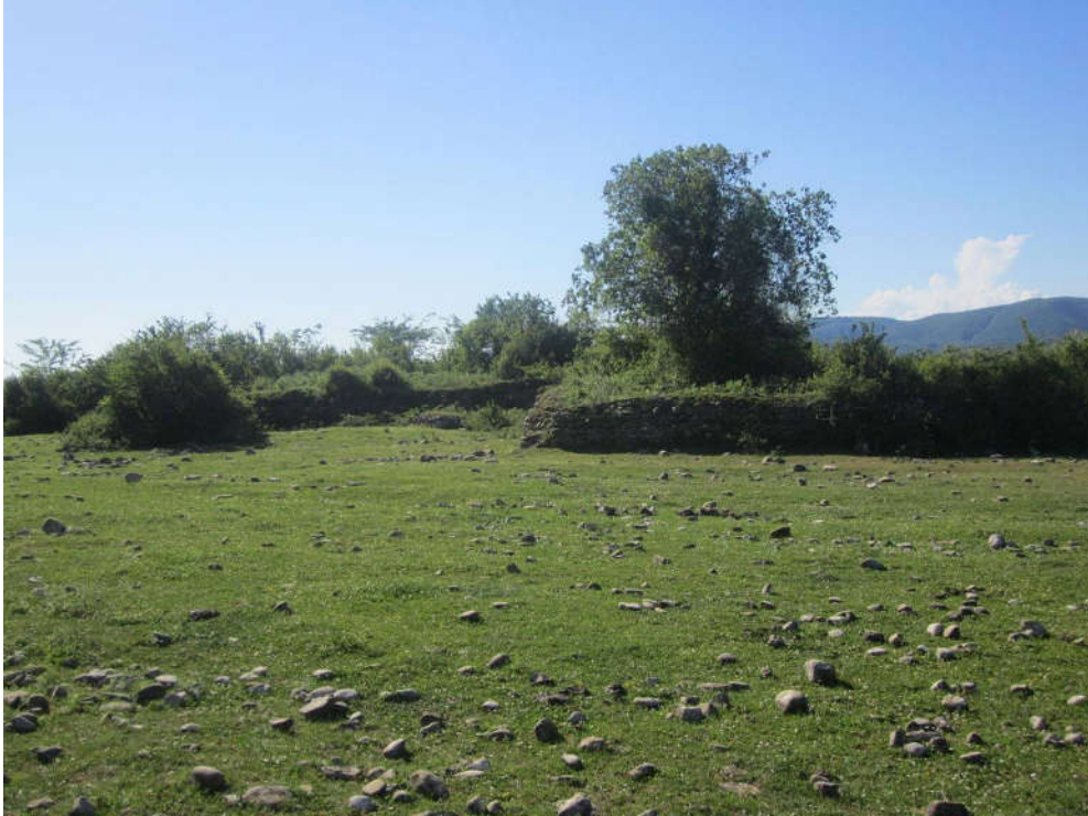
ბანძის „ციხე კეთილნაშენის“ გალავანი. ხედი აღმოსავლეთიდან (ნოჯიხევი).

ოიკონიმთან დაკავშირებულია მიკროტოპონიმები: ბანძაფონი „ბანძის ფონი“ - თავთხელი, მარჩხობი აბაშაზე, არგვანდუდის სამხრეთით (ლეკეკელე); ბანძაშ მინდორი - სახნავი გახუშ წყურგი(ლ)ის ჩრდილოეთით და ბიკინოსორის აღმოსავლეთით. გაშლილი ველია, ნაყოფიერი, უხვმოსავლიანი. პარალელური სახელწოდებაა წაკორტი/წაკორტეფი (ლეკეკელე). გ. ელიავა მიუთითებს „ბანძაში მინდორი“-ს ფორმით, გაშლილი ველის სახელწოდებად, სადაც ციხის ნანგრევებია 49 ; ბანძაში შარა „ბანძის გზა“ - გზა რიონისპირეთიდან ნოსირის გავლით, ბანძისაკენ. ვაჭრებს ამ გზით ბანძაში დაჰქონდათ სავაჭრო საქონელი 50 ; ბანძა - უბანი წყალტუბოს მუნიციპალიტეტის სოფ. გუბისწყალში 51 .