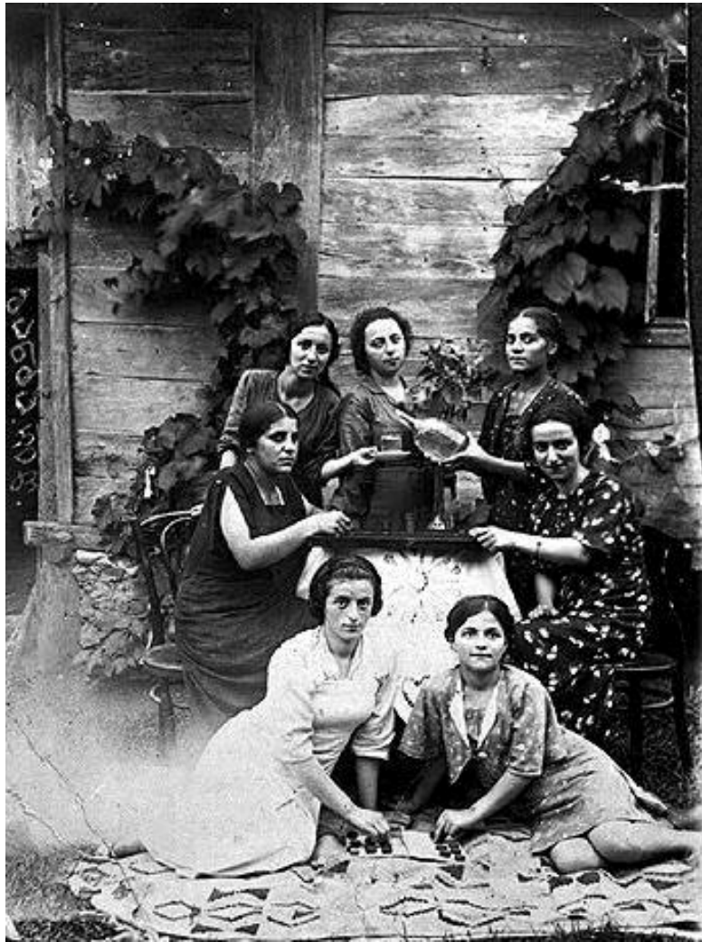
ბანძელი ებრაელი ქალები. 1944 წ.

1928 წელს საბჭოთა საქართველოს ხელისუფლების დადგენილების საფუძველზე, სისხლის სამართლის პასუხისმგებლობის მუქარით აიკრძალა ეკლესიაში, მეჩეთში, სინაგოგაში ბავშვებისათვის რელიგიის სწავლება. მანამდე კი, 1923 წელს, საქართველოში დახურეს 1500 ეკლესია და რამდენიმე ათეული სინაგოგა (იმ ხანად საქართველოში სულ იყო 72 სინაგოგა). რელიგიის წინააღმდეგ ბრძოლა გაიგივებული იყო სოციალიზმისათვის ბრძოლასთან. პერიოდულ პრესაში ხშირად ქვეყნდებოდა სტატიები ებრაელთა რელიგიური დღესასწაულების რეაქციულ სუფზე, რაბინთა ნაციონალისტურ-შოვინისტურ აგიტაციაზე. საწარმოთა ხელმძღვანელები აკონტროლებდნენ შაბათ დღეს, როგორც ებრაელთა უქმე დღეს. ანტირელიგიური აგიტაციის მი-