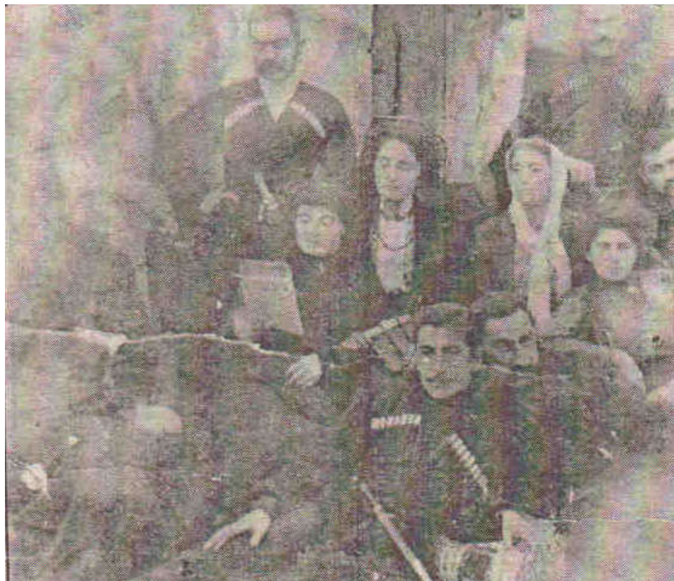
შექსპირის „ვენეციელი ვაჭრის“ მონაწილენი, 1873 წ. ბანძა

სამეგრელოს მრავალრიცხოვან დასახლებულ პუნქტთა შორის ისტორიული წარსულით ბანძას ერთ-ერთი გამორჩეული ადგილი უჭირავს. სოფელი კულტურის მნიშვნელოვან კერას წარმოადგენდა მე-19 საუკუნის მეორე ნახევარში. ბანძა იმ დროისათვის მის გარშემო მდებარე რამდენიმე სოფლის ცენტრად ითვლებოდა. იგი იყო სამეგრელოს ცნობილ თავადთა - ფაღავების საბატონოს რეზიდენცია, ფაღავებისა, „რომელთა სასახლის კარი მუდამ წარმოადგენდა განათლებისა და კულტურის კერას“ (გ. ელიავა).