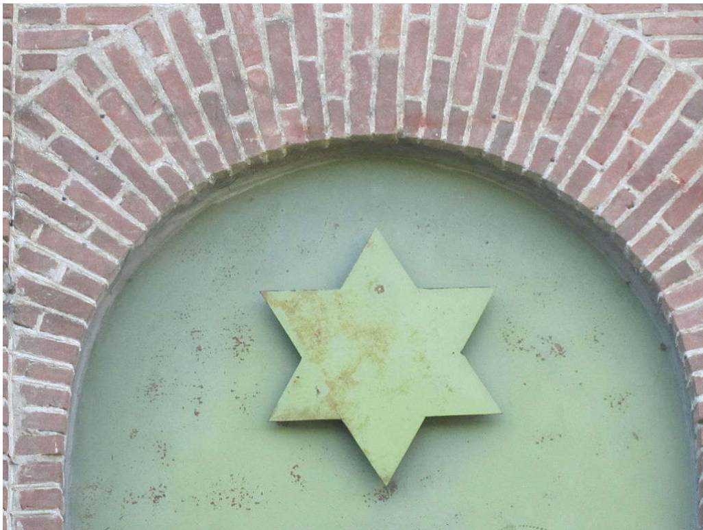
დავითის ექვსქიმიანი ვარსკვლავი. ბანძის სინაგოგა

ენათმეცნიერი პ. ცხადაია „ურიაკარის“ პარალელურ სახელწოდებად მიუთითებს ბაზარს და შენიშნავს, რომ ასე ეწოდება უბანს, სოფლის ცენტრს. მკვლევარი იმოწმებს ინფორმანტთა განმარტებებსაც: აქაა განთავსებული ბაზარი, მაღაზიები, აფთიაქი, ფოსტა და სხვ. ასე რომ, თქმა – ბაზარში მივდივარ, მხოლოდ ბაზარში წასვლას როდი ნიშნავს; ოდესღაც აქ დასახლებულ ერთ ურიას ნავთის გაყიდვა დაუწყია და მაშინ დარქმევია ურიაკარი 103 .