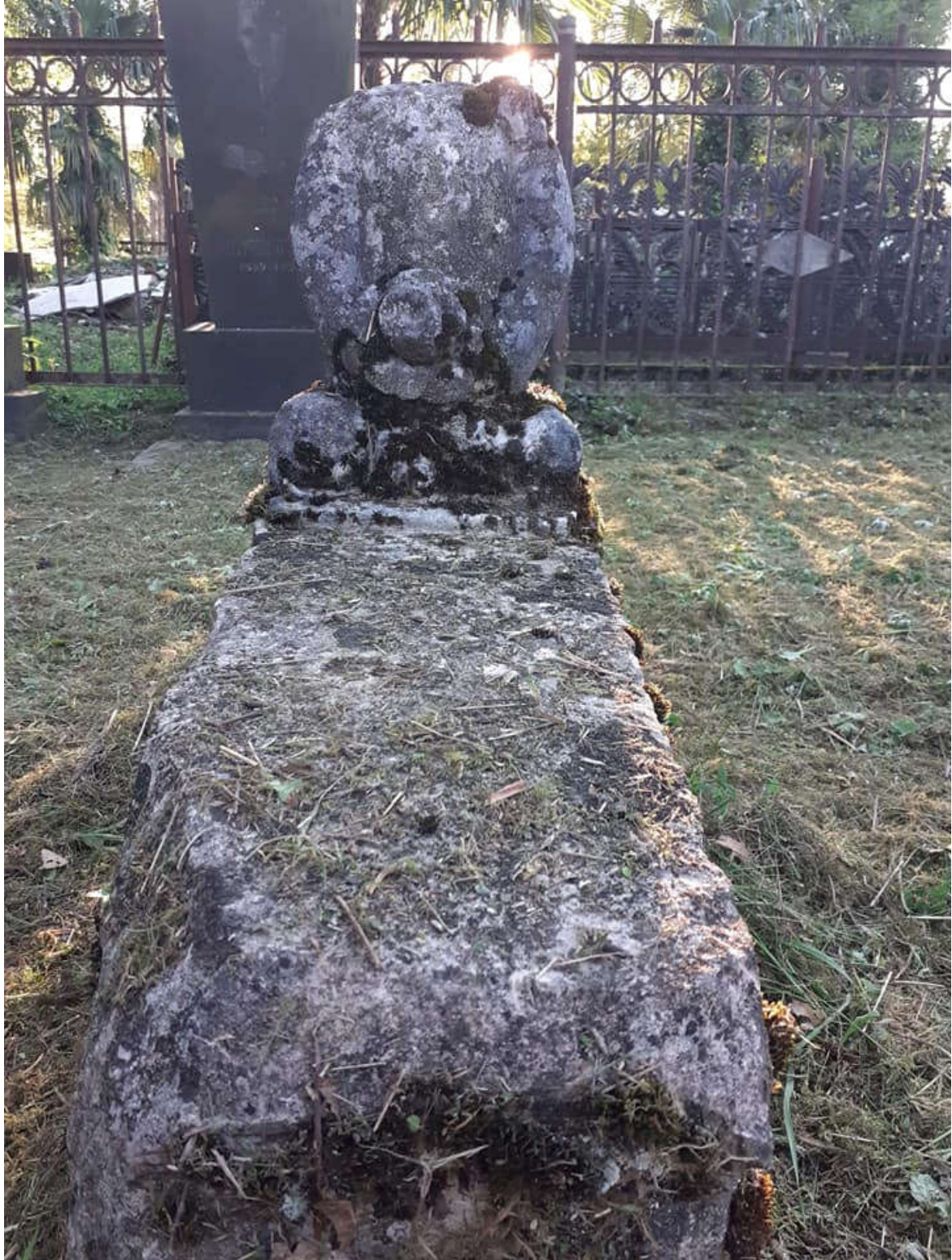
საფლავის ქვა. შაურკარის სასაფლაო. ლეკეკელე