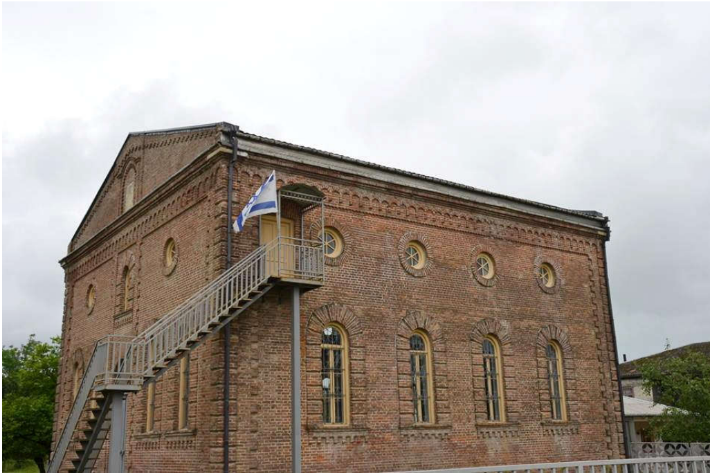
ბანძის სინაგოგა, აჯიაშილების ე. წ. ბეთ ქნესეთი. 1913 წ.

დან, ბანძიდან, კულაშიდან და საქართველოს სხვადასხვა კუთხიდან გადმოსული ებრაელებიო, დაუსაბუთებლად გვეჩვენება 94 . სუჯუნაზე უადრესად ბანძაში ებრაელთა ცხოვრების კვალი ისტორიული წყაროებით არ დასტურდება.