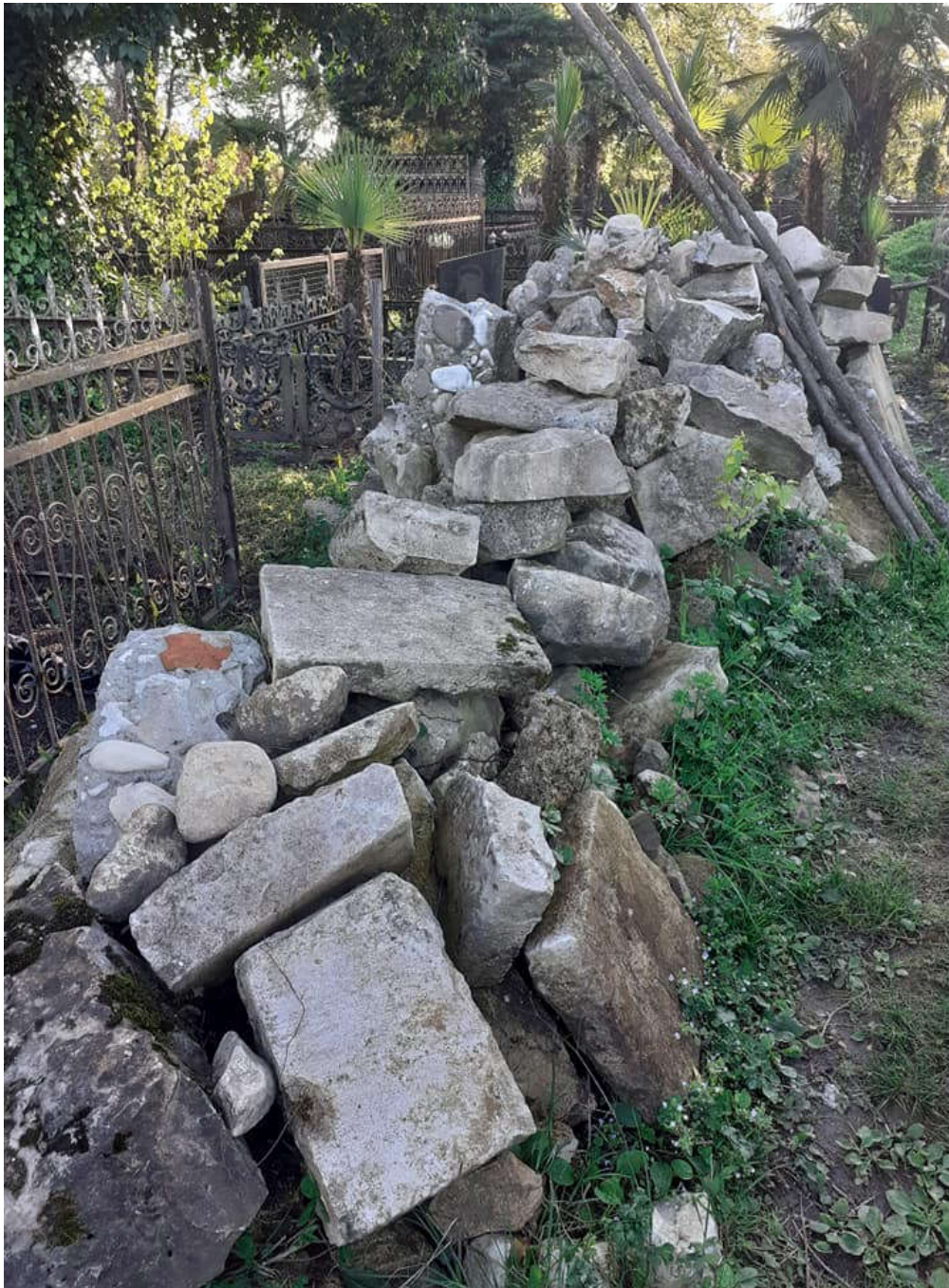
შაურკარის წმ. გიორგის ეკლესიის ნაშთი. შეეწირა საბჭოთა იდეოლოგიას. ლეკაეკელე

ბანძა, როგორც სამეგრელოს მნიშვნელოვანი სავაჭრო პუნქტი, XIX ს-ის II ნახევრიდან აქტიურად მონაწილეობდა ეროვნული ბაზრის განმტკიცების, ძირითადად აღმოსავლეთ სამეგრელოს სოფლის მეურნეობისა და შინამრეწველობის პროდუქციის რეალიზაციის საქმეში. ბანძის სავაჭრო ცენტრად გარდაქმნას