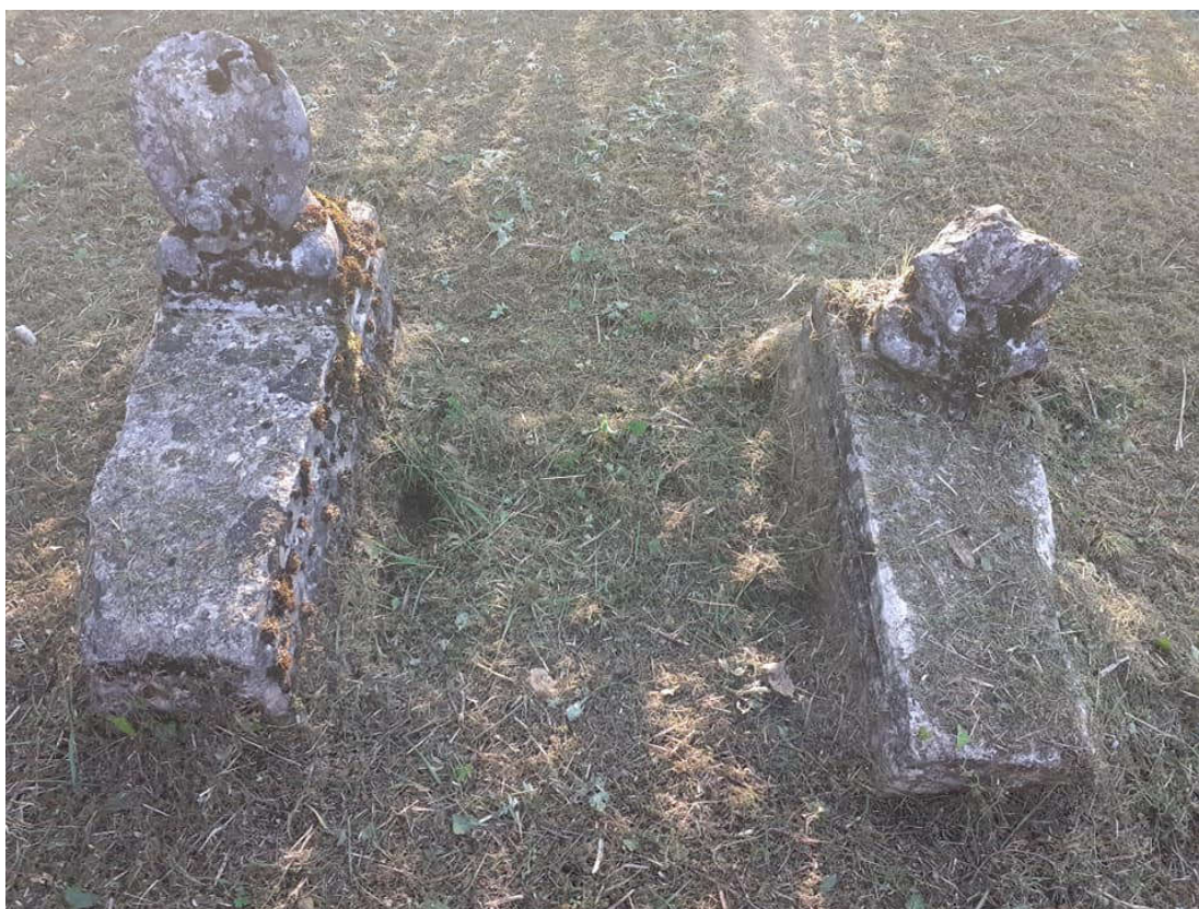
საფლავის ქვები. შაურკარის სასაფლაო. ლეკეკელე. XX ს-ის დასაწყისი.

ბუთი - „ვაშინერს“ 85 . სამოთხე კარის მცირე ტერიტორიაზე შემორჩენილი ურთხელის ცალკეული ეგზემპლარები ბუნების იშვიათი, უნიკალური და მაღალი ესთეტიკური მახასიათებლების მქონე ძეგლებია. რომ არაფერი ვთქვათ ბანძის ურთხელის საკულტო ხედ მიჩნევაზე, იგი, როგორც გადაშენების ზღვარზე მდგომი მცენარე, ენერგიულ დაცვას საჭიროებს. 2020 წლის აპრილში „სამოთხე-კარის“ სასაფლაოს დათვალიერებით დადგინდა, რომ ისტორიისა და ბუნების ძეგლთა მტერს ერთ-ერთი ურთხელისთვის ცეცხლი წაუკიდებია და გამოფუღუროებული ტანი დაუნახშირებია. ვანდალიზმი ამაზე შორს სად წავა?!