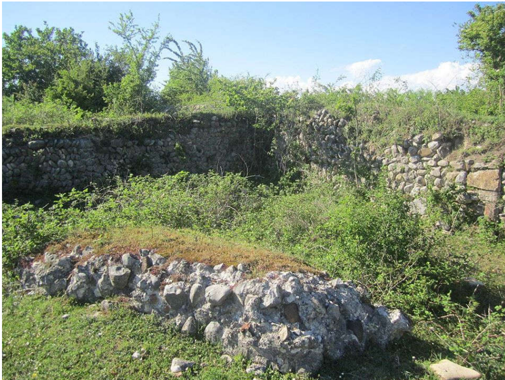
ციხის გალაენის ნაშთი. ხედი სამხრეთიდან

ფაქტია, რომ ნოჯიხევის რვააფსიდიანი ტაძრის წარწერის სახით საქმე უნდა გვექონოდა X ს-ის დასასრულის ერთ-ერთ ღირსშესანიშნავ და მრავალმხრივ გამორჩეულ წერილობით ძეგლთან, რომლისგანაც, სამწუხაროდ, მხოლოდ ნამუსრევი შემოგვრჩა“ 78 . ფილებზე შერჩენილი ცალკეული ასოებისა და სავარაუდო სიტყვების, მათ შორის, თითქოს, მეფის საკუთარი სახელის [ბაგრატ?] აღდგენით, აგრეთვე, X ს-ის დასასრულისა და XI ს-ის დასაწყისის დასავლეთ საქართველოს სამეფო კტიტორული წარწერების ასოციაციური გააზრებით, ვ. სილოგავა შეეცადა ნოჯიხევის წარწერის შემდეგი სახით სავარაუდო აღდგენა-გააზრებას: „სახელითა ღმრთისაითა, აღეშენა წმიდაი ესე ეკლესიაი სალოცველად, აღიდენ ღმერთმან, ბაგრატ აფხაზთა მეფისა და დედისა მათისა გურანდუხტ დედოფლისა“, და პალეოგრაფიული ნიშნების მიხედვით წარწერა X ს-ის, ან XI ს-ის დამდეგის წერილობითი ძეგლების ჯგუფში მოათავსა 79 .