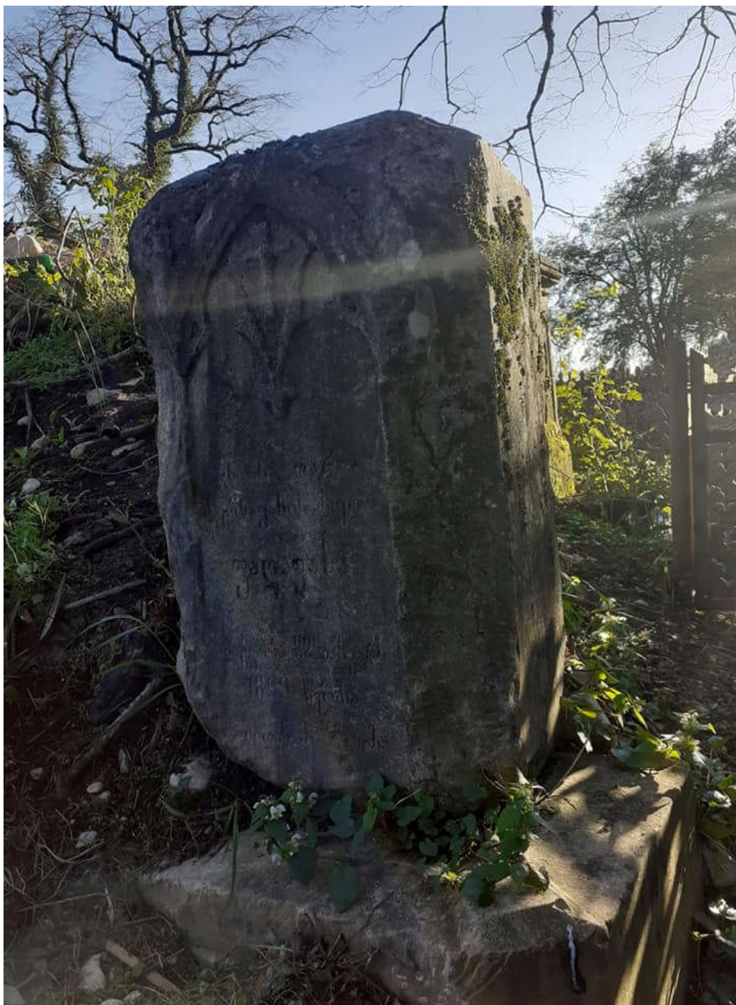
დარია ფადაგას საფლავის ქვა. 1899 წ. შაურკარის სასაფლაო. ლეკეკელე

მუნიციპალიტეტის მერია აქტიურად დაუჭერს მხარს ამ საქმეს და მცირე წვლილს შეიტანს ჩვენი ერის კულტურული მემკვიდრეობის დაცვისა და მიზნობრივი გამოყენების საქმეში.