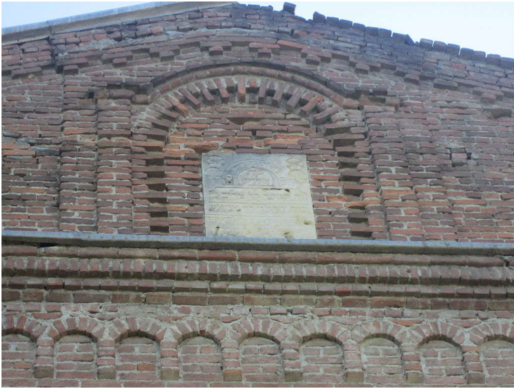
ბანძის სინაგოგის სამშენებლო წარწერა. 1913 წ.