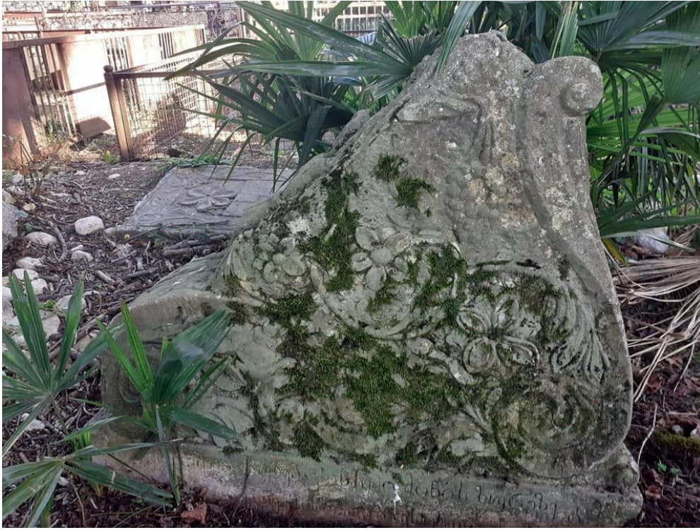
საფლავის ქვა. XIX ს. მიწურული. შაურკარის სასაფლაო. ლეკველე.

ჩვენი ვალია, ახალი ქუჩების გაყვანის, ახალი საცხოვრებელი და საზოგადოებრივი დანიშნულების არქიტექტურულ შენობათა აგების პარალელურად, შევინარჩუნოთ სოფლის ძველი ნაგებობებიც, რადგან ისინი ჩვენ გვაკავშირებს წინაპართა ნაკვალევთან და ტრადიციებთან. სწორედ ამ სიძველეთა წიაღში ტრიალებს ხელშეუხებელი „სული“, განუმეორებელი თავისებურება და უჩინარი მომხიბვლელობა ამა თუ იმ სოფელ-ქალაქისა (გუკოლ ბერიძე).