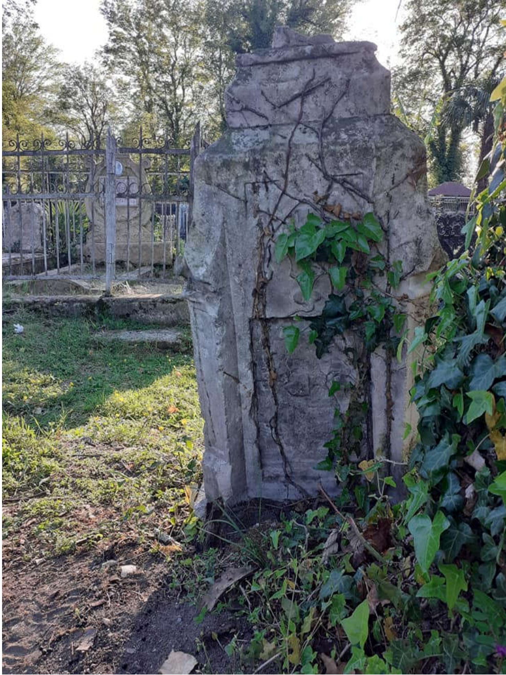
საფლავის ქვა. XX ს-ის დასაწყისი. შაურკარის სასაფლაო. ლეკეკელი.