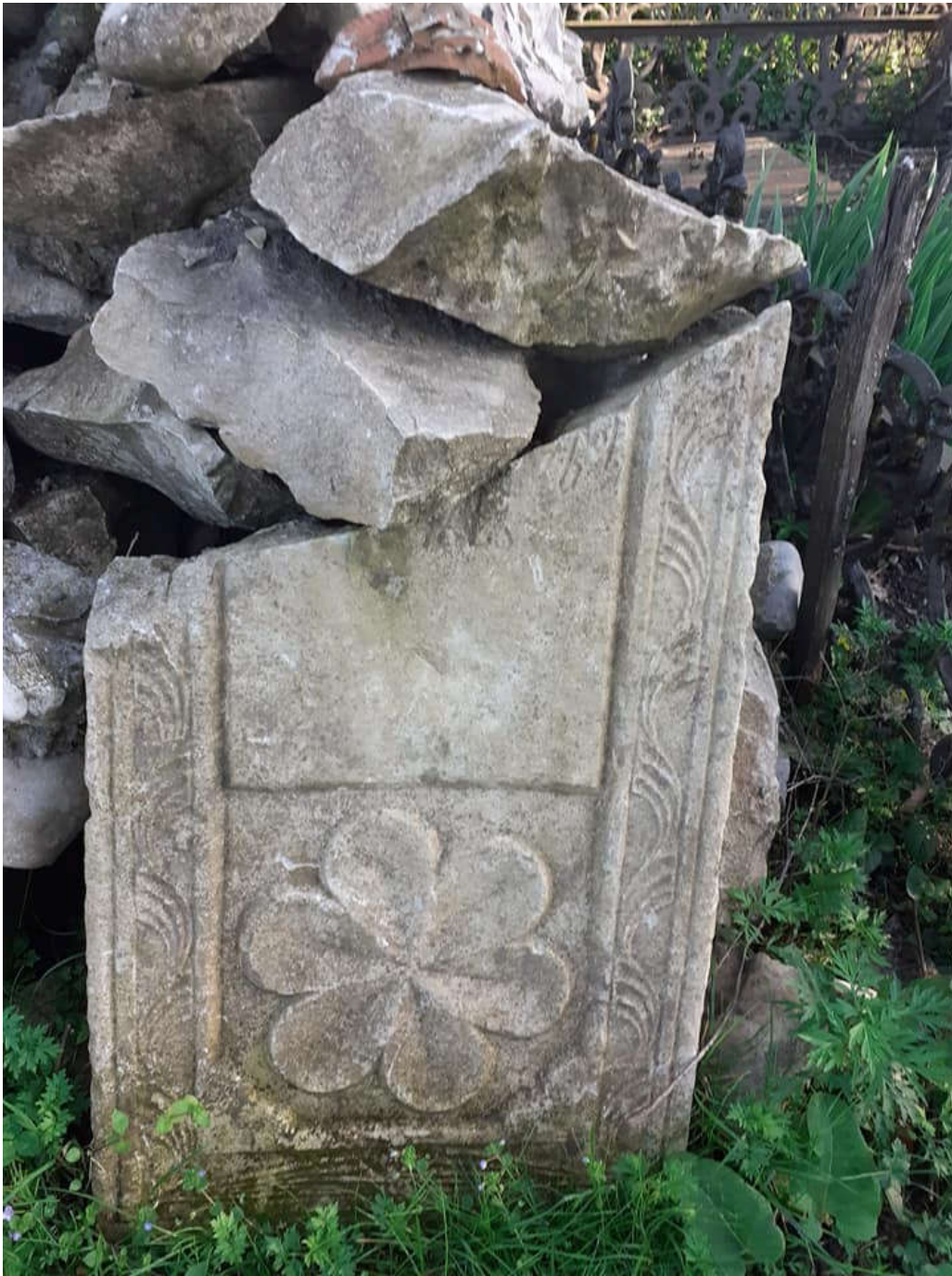
საფლავის ქვის დეტალი. ლეკეკელე

სამოთხის უბანში, „სამოთხე-კარის“ სასაფლაოზე, დგას უროხელის (უთხოვარი, ულპოლველი) საუკუნოვანი ხეები, რომელთაგან ერთ-ერთი ყველაზე ხანსრული და ყველაზე დიდი სარიტუალო ხედ მიიჩნეოდა და მას მოკრძალებით ეპყრობოდა მოსახლეობა. ხესთან მიჰქონდათ ძვირფასი შესაწირავი, რასაც ლოცვის შემდეგ იქვე სტოვებდნენ. ამ ნივთების სახელში წადება იკრძალებოდა ტა-