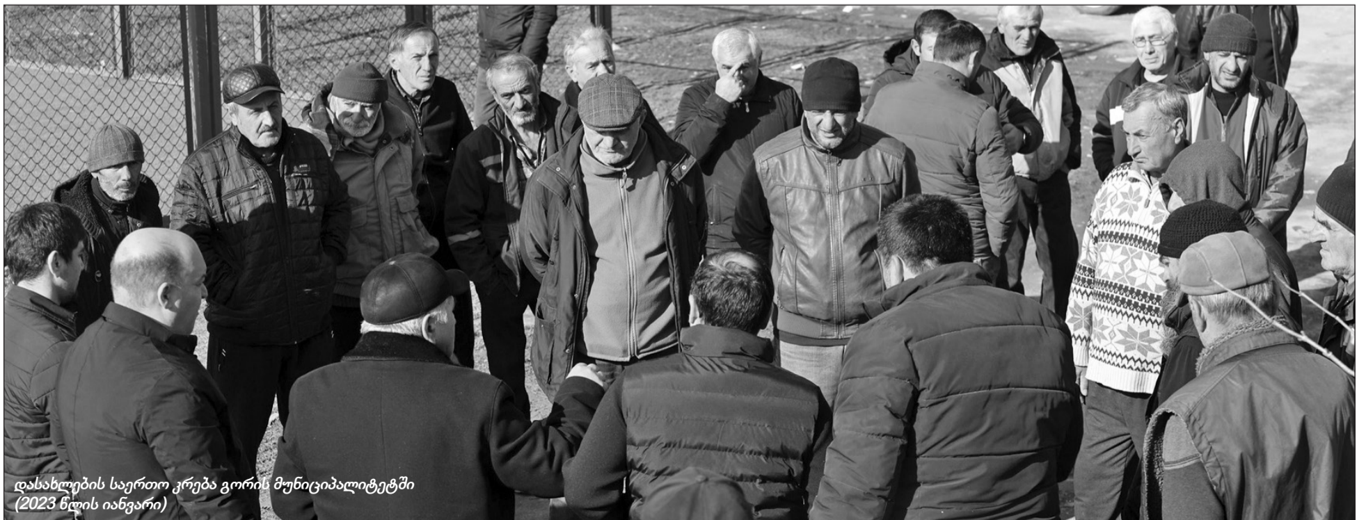
დასახლების საერთო კრება გორის მუნიციპალიტეტში (2023 წლის იანვარი)