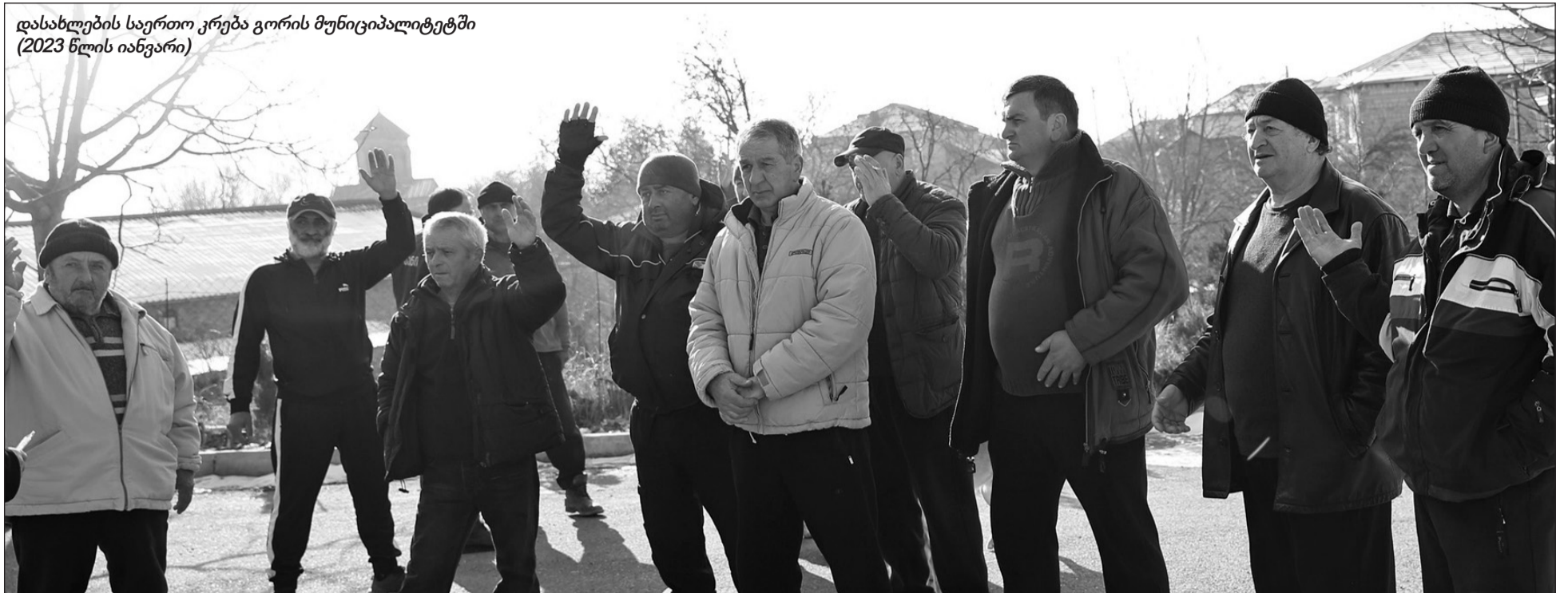
დასახლების საერთო კრება გორის მუნიციპალიტეტში (2023 წლის იანვარი)