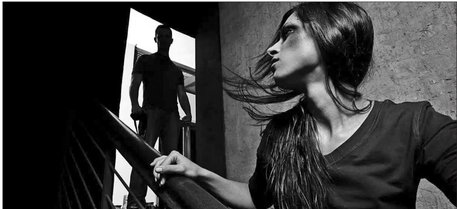
დასაწყისი მე-4 გვ.-ზე

რომელიც შეიძლება იყო გატაცების მსხვერპლი, საოკუპაციო ხაზთან ე.წ. საზღვრის კვეთის ბრალდებით დაკავებული და ა.შ. ეს ადამიანები შეიძლება იყვნენ წამების და ძალადობის მსხვერპლები, როგორც არის მუქარა, შეშინება და სხვა.