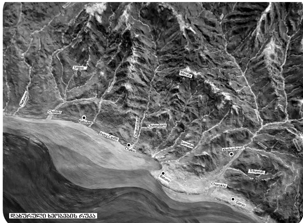
დახურული ხეობების რუკა

როგორ მივაკვლიე. როდესაც ჩაისუბნის ძეგლის ტერიტორიაზე ვიმყოფებოდით, კითხვა დავსვი: რატომ იყო განთავსებული ეს ქურა-სახელოსნო ამ ადგილზე? აქ თავის დროზე მომუშავე არქეო-