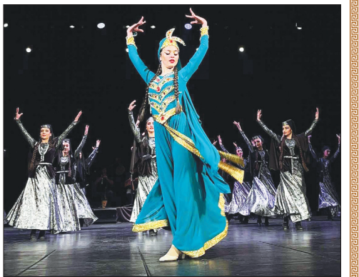
ქართველ ხალხის სულის და ნებას, ნაპერწკლების ცეცხლით შეძლებს თვით ლა სკალის განათებას.

შრომა უნდა მირიადი, ცერზე დგომას და აფრენას, ცეკვით შეძლებს ზენაარი იაღბოზე გადაფრენას. რადგან გულწრფელად აღვივებს,