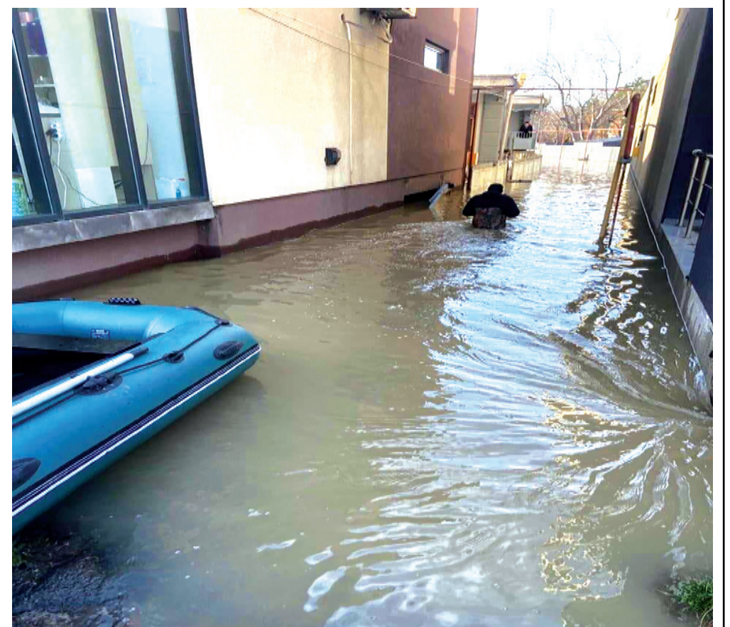
(გაგრძელება II გვერდზე)

გვაზღვევინებს. რომ მთელი მსოფლიო უნდა დაირაზმოს და კლიმატური ცვლილებების რაიმე პრევენცია მოვახდინოთ და ათასი მსგავსი რამ. და რა მერე? წელიწადი არ გავა, რომ უმაღლესი დონის შეხვედრები არ გაიმართოს