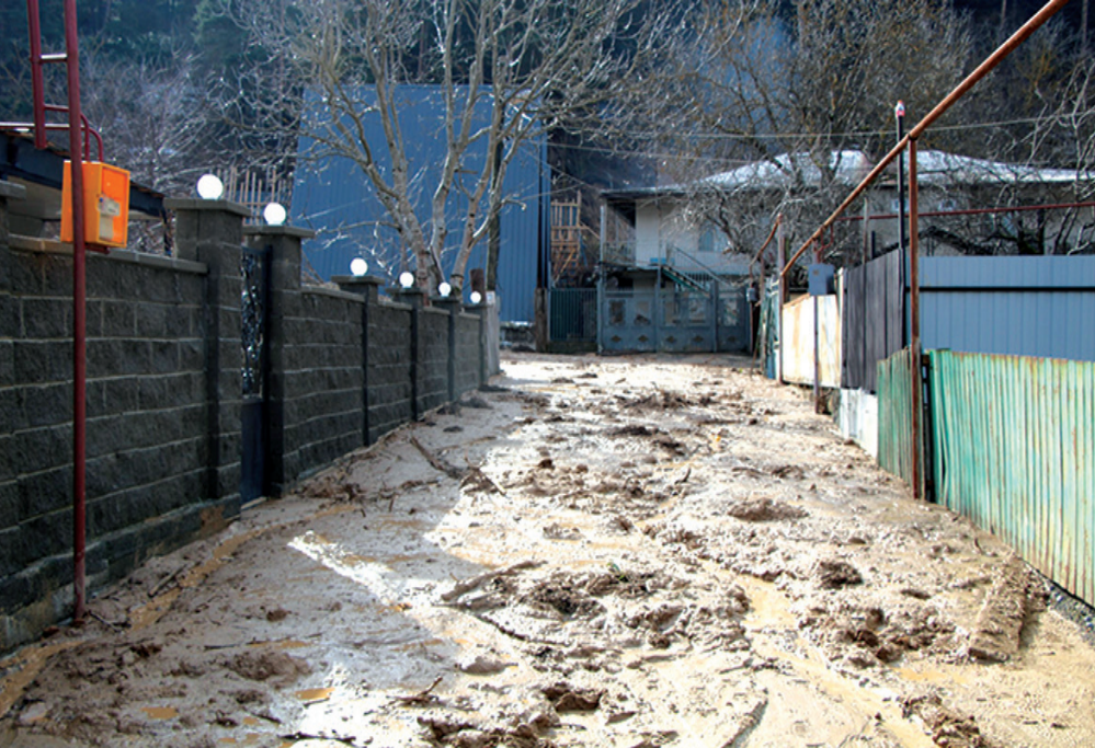
მიმართა. დაიტბორა ასეულობით ოჯახი, პირველი სართულები მთლიანად წყლითაივსო, განადგურდასაყოფაცხოვრებო ტექნიკა. მთელი დამეცა მეორე დღე ადგილზე იყვნენ ქალაქის მერი და მისი მოადგილეები, სამამუველო

დეტალურად. 5 თებერვალს, შუადღემდე, მშვენიერი ამინდიც კი იყო. აი, შუა დღის მერე დაიწყო და დაიწყო. წვრილ წვიმას კოკისპირული ცვლიდა და ასე, გაუჩერებლად. 6 თებერვალს, მთელი დღე მოღებული ჰქონდა ცას პირი და დამეც გაგრძელდა. ბუნებრივია, პატარა მდინარეები, რომლებიც, ერთი შეხედვით, ჭიას არ გააღვიძებენ, გადაირივნენ. განსაკუთრებით, შოლა გაგიჟდა. ქალაქის სამხრეთით მდებარე ამ პატარა მდინარემ (ზაფხულში დღე რომ უფრო ეთქმის) თავისი მსახვრალი ხელი პირდაპირ ქალაქისკენ