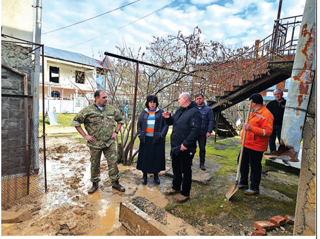
პრევენციული ჩარევით პროცესი შეწყდა და მოსახლეობამაც ამოისუნთქა. სამწუხაროდ, პროცესი, გარკვეულწილად, განახლდა და, როგორც ზემოთ აღვნიშნეთ, ორმოცი ოჯახი იძულებული გახდა, სახლები მიეტოვებინა,

იგივე მოხდა ე.წ. გადაღმა უბნებში. სტიქიამ არც მუნიციპალიტეტის სოფლები დაინდო. დაიტბორა ქვიშხეთის, ნაბახტევის, ალის, ოსიურის, ცხეთიჯვრის, უწლევის, ზემო აძვისის მოსახლეობის ნაწილი და სასოფლო-სამეურნეო სავარგულები-მცირე-მცირე პრობლემა თითქმის ყველა სოფელს შეეხო. ცალკე თემმა სურამი, სადაც მოვარდნილმა ღვარცოფმა მეწყერის პროვოცირება მოახდინა და ორმოც ოჯახს შეუქმნა პრობლემა. მკითხველს, ალბათ, კარგად ახსოვს, მეწყერული პროცესები სურამში, კონკრეტულად კი, ზინდისის უბანში, ჯერ კიდევ 2007 წელს დაიწყო. მაშინ იმდენად რთული სიტუაცია შეიქმნა, რომ მთელი უბნის დაცარიელებაზეც კი იყო საუბარი-მეწყერულმა პროცესებმა მთლიანად დაშალა რამდენიმე სახლი. პროცესი, პრაქტიკულად, მთელ უბანს შეეხო. თუმცა, შემდეგ ადგილობრივი ხელისუფლების, გეოლოგების, მთავრობის სხვადასხვა