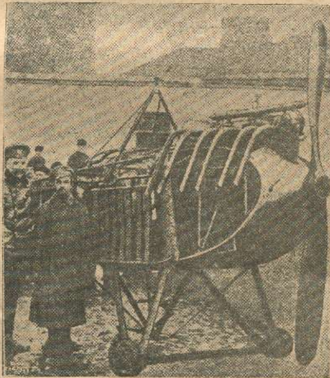
გერმანული ჰაეროპლანი, წართმეული თავ. ერისთავისაგან.

მომხსენებელმა ზ. კაცენელენბაუმმა (ავტორი ამ მოკლე ხანში მეორედ გამოცემულ შრომისა — „მელიორაცია, მელიორაციული ამხანაგობა და მელიორაციული კრედიტი რუსეთში“) მოსკოვის სასოფლო-სამეურნეო საზოგადოების საერთო კრებას თავის შრომაში — „მელიორაციული დეპარტამენტი და მისი 1914 წ. მოსახრებანი“ — შემდეგი მეტად საგულისხმიერო ცნობანი მიაწოდა.