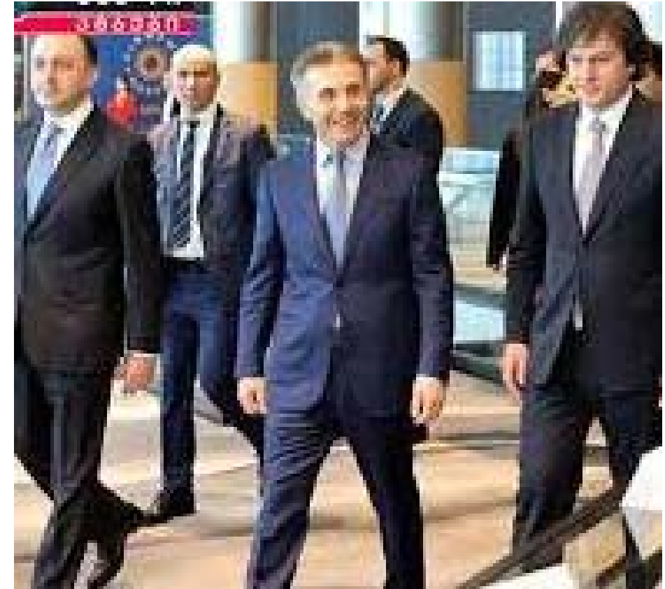
ლაჩაბაშვილი — ბაკაბი, კობახიძე — საბილაროვის მუშაობაში, ივანიშვილი — იმპორტის მუშაობაში და რიგითი

საზოგადოებრივ-პოლიტიკურ სფეროში „პროპაგანდა“ 2 თბაკალი განსაზღვრული მთავრობისთვის პარტიასთან დაკავშირებული წესები, აკრძალული რიგები, აკრძალული წესები, აკრძალული რიგები ეს არის ბიძინა ივანიშვილის დასახელება