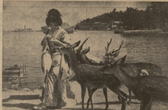
სამხრეთ-დასავლეთ საქართველოში... მხრო, დიდი კონკრეტული, კონკრეტული...