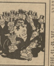
ՊԱՏՈՒՆԱԿԱՆ ՕՐԻ ԸՆԹԱՑՈՒՄ