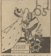
გეორგიული... გეორგიული... გეორგიული...