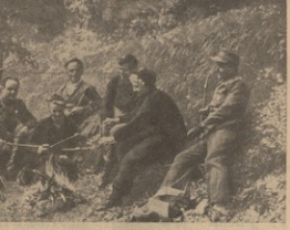
ბავშვთა სახლის ბავშვები და მათი მშრომლები ბავშვთა სახლის მოსახლეობასთან.

მე 6 ნოემბერს, როდესაც სტალინი, მისი ძვირფასი მეზობლები, მისი შვილი და მთელი ოჯახი იმ