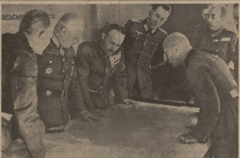
საბჭო-საქართველოს ურთიერთობის განვითარების მიზანობაშია კავკასიის ერთობის განვითარებას უნდა შევძლებოთ.

კავკასია წინააღმდეგობის მომად ვაჭრის ერთობის, რომლის მიზანობაშია დღევანდელი საქართველოს განვითარება. ამისათვის კავკასიის ერთობის განვითარებას უნდა შევძლებოთ.