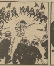
ԳՐԱԿԱՆ ԱՊՐԱՆԱԿԱՆ ՕՐԻ ԸՆԹԱՑՈՒՄ