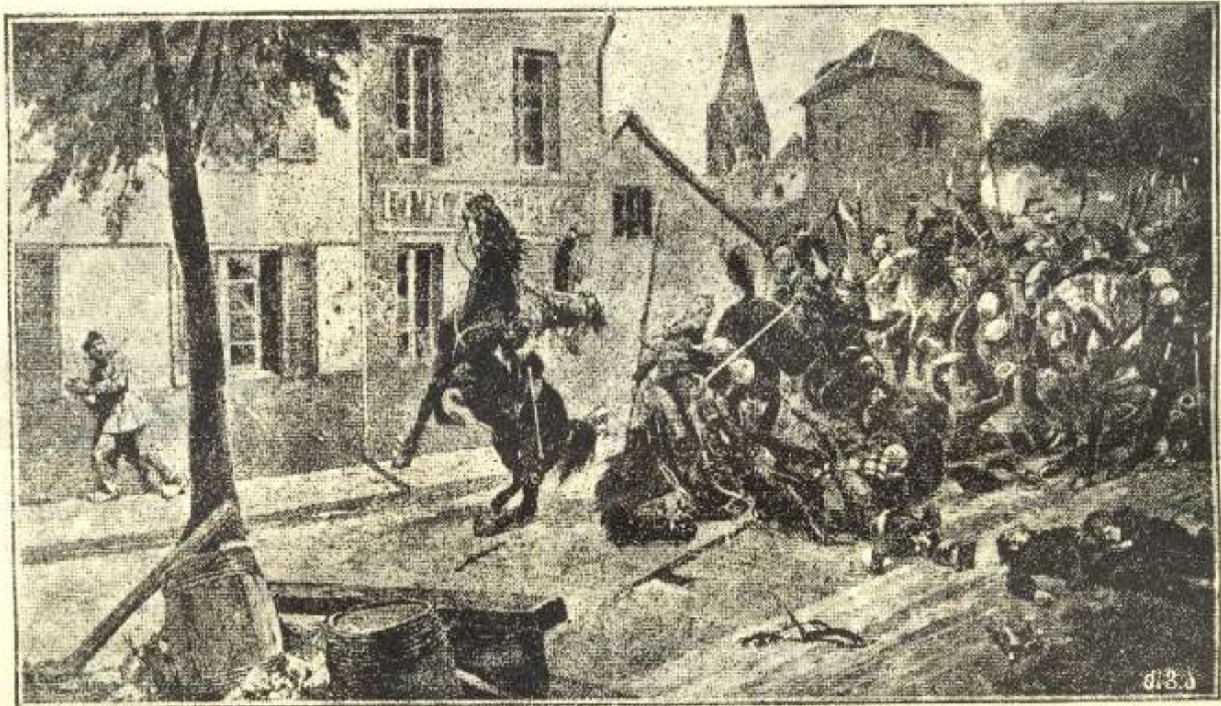
ერთი ეპიზოდი ინგლისის ტყვიის მტყორცნელთა მოქმედებისა გერმანელ ცხენოსან ჯარზედ.

ის სიტყვიერი გამოსვლანი დიდ სახელმწიფოთა წარმომადგენლებისა, რომელნიც თითქმის ყოველ დღე ირევიან ზარბაზნების ქექა-ქუხილთან, ის სხვა და სხვა მოწინავე პირთა წერილები უმაღლეს საკაცობრიო იდეალების შესახებ, დღეს-დღეისობით შეიძლება შევადაროთ იმ ოქრო ვერცხლის სევადას და ჩუქურთმას, რომელიც ამშვენებს ხოლმე გულის გასაგმირ, მომაკვდინებელ იარაღსა.