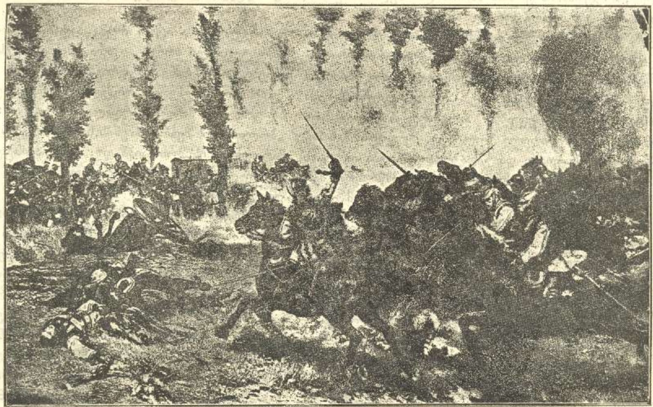
ი ბ რ ი შ ი!

მისამართი: თბილისი, Габаевский пер. № 3 რედაქცია „კლდე“. დეპეშისა: თბილისი კლდე.