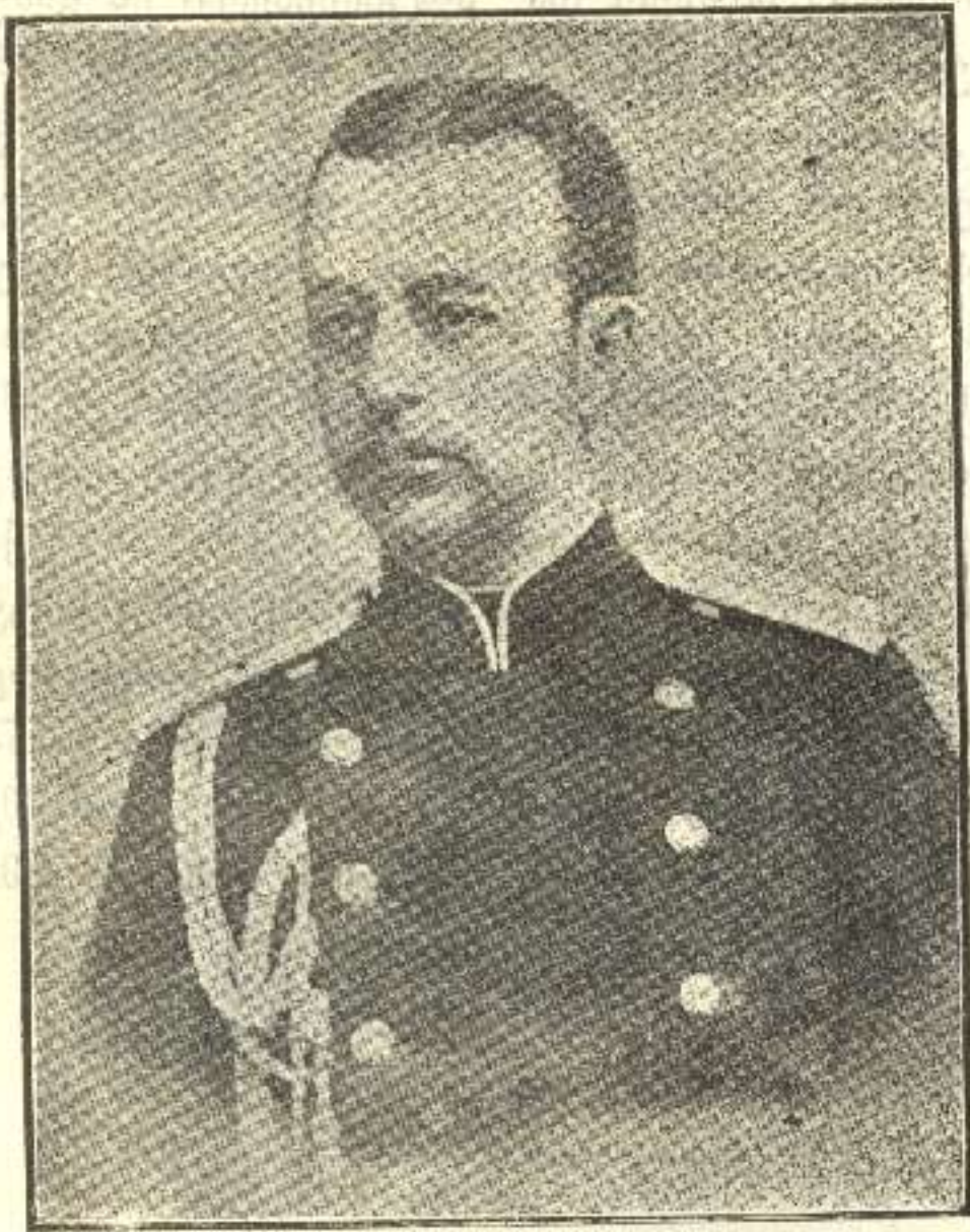
რუსეთის მიერ დაპყრობილ გალიციის გენერალ-გუბერნატორი გრაფი ბობრინსკი.

სამაგიროდ ჩვენი სოფლის მოუწყობლობამ ეხლა უფრო მძლავრად იჩინა თავი და ომისაგან შექმნილი კრიზისი უღმობელად დააწვა მას კისერზედ. ჩვენი სოფლის კეთილდღეობა დამყარებულია მელვინეობაზედ - მითი უძღვება კახელთა რეზერვუალსა, სახელმწიფოსა, საკუთარი ხორბალი კახეთს 4 5 თვესაც არ ჰყოფნის და წრევანდელ უმოსავლო წელიწადს ხომ ეხლავე ვგრძნობთ პურის ნაკლებობას. მუშა ხელი შემცირებულია და როცა უფრო საჭირო შეიქმნა კახეთისთვის გარეშე დახმარება, სწორედ მაშინ გამოცხადდა ღვინით და არაყით ვაჭრობის აკრძალვა და ცეცხლს ნავთი დაესხა.