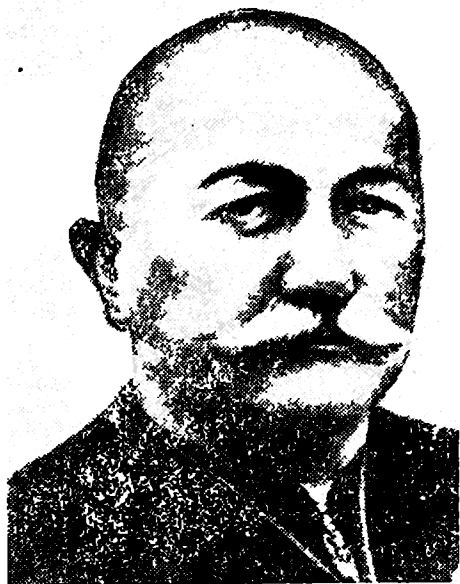
ვასილ აბღუშელიშვილი, 1947 წ.

ეს პატარა წიგნი დიდმა სიყვარულმა დამაწერინა, დიდმა სიყვარულმა იმ ადამიანისა, რომელმაც მთელი სიცოცხლე ქართველი მოზარდების ჩინებულ მოქალაქეებად ჩამოყალიბების კეთილ საქმეს მოახმარა, რომელმაც მთელი სიცოცხლე კარგი კაცის სახელი ღირსეულად ატარა, ხოლო როცა აღესრულა, ეს სახელი აქ დაიტოვა. დიდი ხანია წავიდა ის და დაცარიელდა ადგილი, რომელიც მას ეჭირა ამ ქვეყანაზე... მერე მიდიოდნენ წლები. მიდიოდნენ ადამიანები, იცვლებოდნენ მათი ჩვევები, შეხედულებები. ფასეულობები და ის, რაც გუშინ ჩვეულებრივი და ყოველდღიური რამ იყო, დღეისათვის, და მით უმეტეს ხვალისათვის, კრავდა ცხოვრებისეულ საყრდენს და ნიადაგგამოცლილი ლეგენდების სამყაროში გადადიოდა... ასე, თანდათან ამ ლეგენდების შარავანდდით სხიმოსილი წარსული, ჯერ ჩემი ხსოვნის, ხოლო შემდეგ ამ პატარა წიგნის ფურცლებზე ლაგდებოდა და, ალბათ, ამიტომ ის უფრო ლეგენდების წიგნი გამოვიდა, ვიდრე ქრონიკებისა; მაგრამ წიგნს მაინც „ვასილ აბღუშელიშვილის