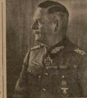
ღღმა აღლურ მბრბობმა კაიტელი დანიშნა ვერბრად-ფელდმარშალად.

სარბრბევიან მბრბობისა და ზავის დღებში შეტევა ვერმანიის ხალხის ხე-