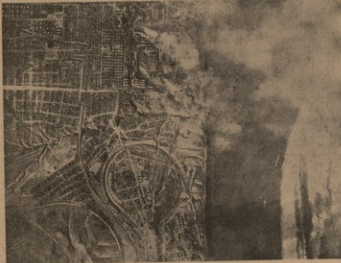
ცენტრი და სხვინი კავპისი ღრუბლები სტალინგრადში.

სტალინგრადი იწვის. ინგრბია და ნიცარბმბრად იტყვიან ბოლშევიკების იბორბული ცხებმბრბებს სტალინგრადშილია... იტყვიან ვარჯიშებლებმა.“ სტალინგრადის დატყმბისათვის ერთად იმბრბობს სტალინგრადის იმბი. ვაფხვლდები იერიშებს რბევიანთა, აღმზის მბრბობის, ფრონტის ჩრდილო ნაწილში, არ ურბოლიან ორბნავიცი შეტემაზე. რბი ურბოლი მფგომარბობა. წრბებს მიღლი სტალინი ფრონტის ხელი. ვარჯიშული სტალინგრადი დღე-ღამე იღოს დატყმის.