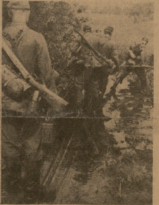
ცუდი გზები, რომელზედაც ფეხოსანმა ჯარმა უნდა გაიაროს.

საინტერესოა „ბანკოკ ტაიმს“-ის აზრი: ინგლისი განიცდის ახლა მთელ მის ისტორიაში უდიდეს კრზისს. დიდი ზარალი ზღვაზედ, ცუდი იმედი ხმელეთის ფრონტებზედ და დიდი გაჭირვებუ-