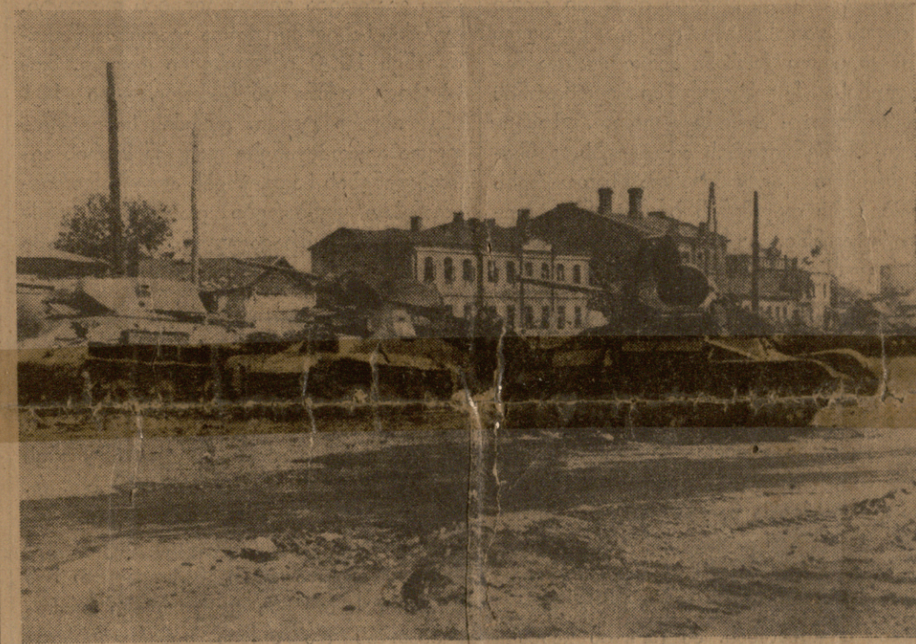
ბოლშევიკების დამსხვრეული ტანკები ვორონეჟში.

თანამედროვე ეროვნული სახელმწიფო არ უარყოფს კლასთა არსებობას და კლასობრივ ინტერესთა სხვადასხვაობა მას საფუძვლით ნორმალურ მოვლენად მიაჩნია. ყოველ ინდივიდს, აგრეთვე ყოველ სოციალურ კლასს თვისი საკუთარი ინტერესები გააჩნია. მათი განსაკუთრებული მდგომარეობის მიხედვით. მაგრამ ინტერესებზე ასეთი გადარჩევა სრულიადაც არ ნიშნავს ეროვნული საერთო ინტერესების არ არსებობას.