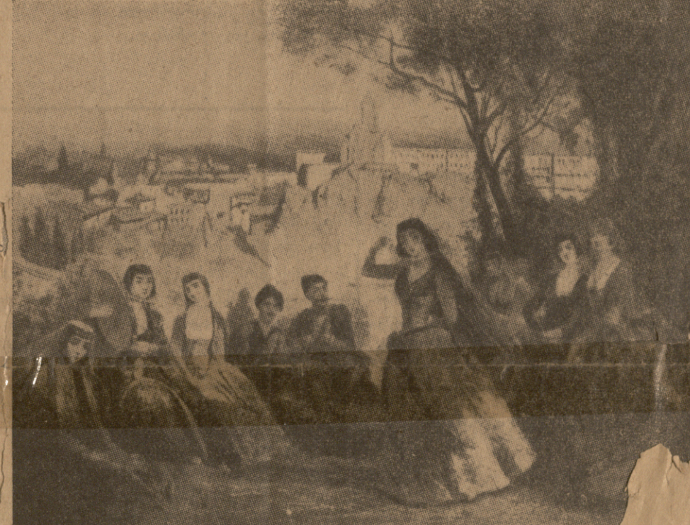
ცეკვა ძველ ტფილისში.

ლიც“, „მუშაც და გლეხიც“ მთელი რუსისი ერი და რუსეთის უზარმაზარი იმპერიის ყველა ერი გაანადგურა რეზიკურად და სულიერად. დღევანდელ დღემდე გრძელდება — დიქტატურა ვიცი თ ეს ჯოჯოხეთი, და ამ ჯოჯოხეთის დამკვიდრებას მარქსიზმი მთელი კულტურულ კაცობრიობას უქადის როგორც სამარადისო და „საუკეთესო“ წესს საზოგადოებრივი ცხოვრებისა. — როდესაც ისპანიაში პოლიტიკურ უფლებათა მოპოვებისათვის და სოციალური ცხოვრების გარდაქმნისათვის რევოლუცია მოხდა და ძველი რეჟიმი დაამხეს რევოლუციონერებმა, მარქსისტები დაეპატრონენ იქაც სახელმწიფოს და ისევე დაუწყეს განადგურება მთელი ერს და ისეთივე სიმეცით, როგორც რუსეთის იმპერიაში გაანადგურეს ერები იმავე მარქსისტებმა. საბედნიეროდ ისპანიის ერმა საკმარისი ძალა ჰპოვა თვის სიღრმეში, რომ მარქსისტული ჯოჯოხეთითგან თავი დაეხსნა, მაგრამ ამისთვის სამი წლის სამოქალაქო ომი დასჭირდა მას, და ამ ომისაგან დაღლილი ესპანია ჯერ კიდევ სრულიად ვერ გამომრთელვებულა. მ. წ. (გაგრძელება იქნება).