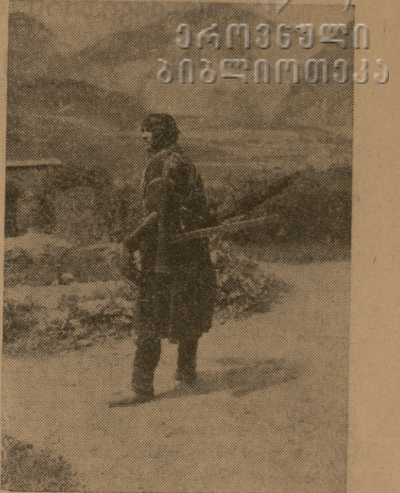
ხ ე ვ ს უ რ ი .

და გადვიდენ უკვე ღონზედ აღმოსავლეთით და სამხრეთით. — როსტოვის დაკარგვით ბოლშევიკებმა დაჰკარგეს შემაერთებელი ხიდი კავკასიასთან და ღონეცის ბასენთან. როსტოვში ითვლება 520 000 მცხოვრები და მათე ქალაქია სიდიდით საბჭოთა კავშირში. იქ დიდი მრავალგვარი მრეწველობაა. ნავთსადგურს როსტოვისა მესამე ადგილი უჭირავს საბჭოთა კავშირის ნავთსადგურთა შორის როსტოვის დაკარგვის შემდეგ ბოლშევიკები მალე იგრძნობენ.