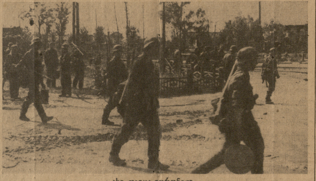
ასე დაეცა ვორონეჟი.

სულ 616 გემი მტრისა 3 348 200 ბრ. რ. ტონნისა, ამათგან მარტო ამერიკის წყლებში 467 გემი 2 917 600 ბრ. რ. ტონნისა. მოხარული და მოამაყე ამ მიწვევებით გიცხადებთ თქვენ, ნავთა კომენდანტებს და გმირ მეზღვაურთ ჩემ მადლობას თქვენი დაუღალავი ბრძოლისათვის და თქვენ გამარჯვებათათვის!“