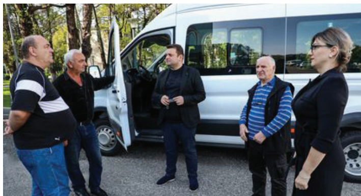
მუნიციპალიტეტის მერიის საზოგადოებასთან ურთიერთობის და ინფორმაციული უზრუნველყოფის განყოფილება

2023 წლის გამოშვების, FORD-ის მარკის მიკროავტობუსი შევიძინეთ. წლების წინ შეძენილი ავტოსატრანსპორტო საშუალება მწყობრიდან იყო გამოსული. დღეიდან, ჩვენს წარმატებულ სპორტსმენებს, ახალი მიკროავტობუსი მოემსახურება. სასპორტო გაერთიანების სპორტსმენებმა, სპორტის სხვადასხვა სახეობაში, არაერთხელ ასახელეს ჩვენი ქალაქი. მათ ექნებათ ყველა პირობა შექმნილი იმისთვის, რომ იფიქრონ მხოლოდ წარმატებებზე, მათთვის ბევრი რამ კეთდება და იგეგმება. ჩვენი სახელისუფლებო გუნდის ერთ-ერთი მთავარი პრიორიტეტი ახალგაზრდებისთვის მეტი შესაძლებლობის მიცემაა მათი განვითარების და თვითრეალიზაციის კუთხით“ - აღნიშნა მუნიციპალიტეტის მერმა, ვახტანგ გადელიამ.