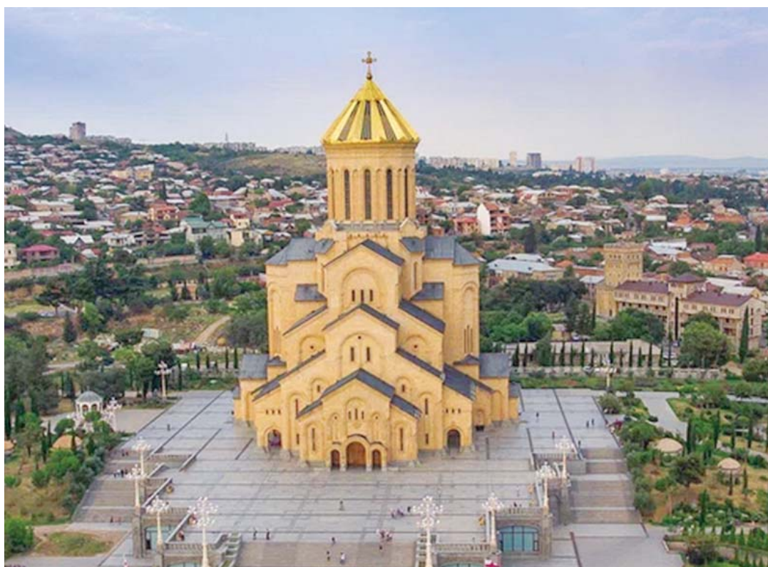
ღათობით, ღათიანით, სიბრძნითა და სიყვარულით!