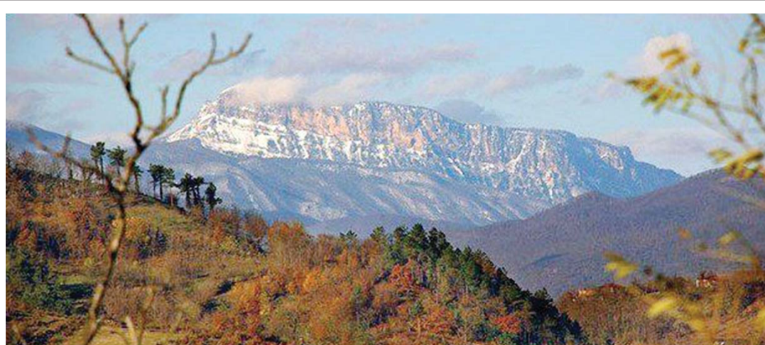
„ოდეს ჰყვანას გაუჭირდეს, ხვათღის მთამ გადაარჩინოს“ ...