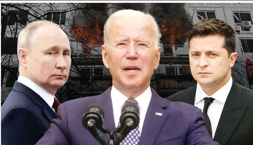
დასავლური რეალობა ვირტუალური დემოკრატია