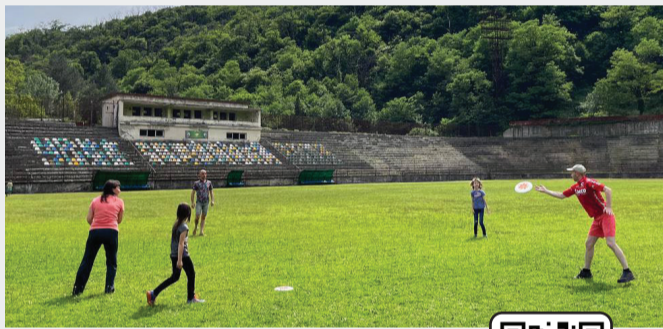
შემოუერთდით ჩვენს ჩატს

ფრიბილის გარდა, იგეგმება სხვადასხვა სამაგიდო თამაშების, ფრენბურთის, კინოჩვენებებისა და საცეკვაო საღამოების ორგანიზება. სწორედ ამ მიზნით, სოციალურ ქსელში (Messenger, Telegram) ჩატი შეიქმნა, სადაც რეგულარულად ქვეყნდება სხვადასხვა აქტივობების შესახებ.