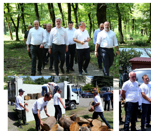
პრემიერ-მინისტრის ინიციატივით, აღნიშნული პროექტი 1 მარტს დაიწყო და ამ დროისთვის 20 ათასამდე ადამიანია დასაქმებული. მათგან 1000-მდე ხელშეკ-

რულება სოფლის მეურნეობის სამინისტროს სააგენტოებშია გაფორმებული.