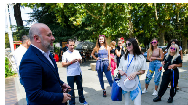
ონი მსოფლიოს ციფრული მედიის ყურადღების

იმერეთმა არაბეთის გაერთიანებული საემიროდან ჩამოსულ 200 საერთაშორისო მედიანარმომადგენელს, ბლოგერსა და ინფლუენსერს უმასპინძლა, რომლებიც ღირშესანიშნაობებს, დაცულ ტერიტორიებს, კულტურული მემკვიდრეობის ძეგლებს, იმერულ მარნებსა და გასტრო სახლებს ესტუმრნენ. სამი დღის განმავლობაში იმერეთის რეგიონში მოექცა!