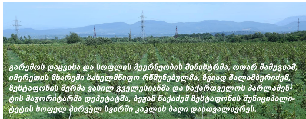
გარემოს დაცვისა და სოფლის მეურნეობის მინისტრმა, ოთარ შამუგია, იმერეთის მხარეში სახელმწიფო რწმუნებულმა, ზვიად შალამბერიძემ, ზესტაფონის მერმა ვასილ გველესიანმა და საქართველოს პარლამენტის მაჟორიტარმა დეპუტატმა, ბეჟან ნაქაძემ ზესტაფონის მუნიციპალიტეტის სოფელ პირველ სვირში კაკლის ბაღი დაბითვალავენ.