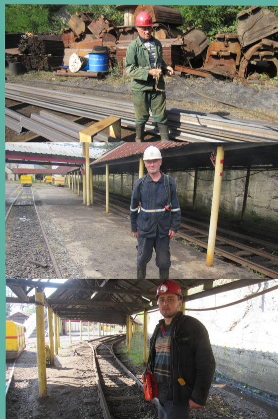
ცეიფურიშვილები - მუშახტების სამი საამაყო თაობა!