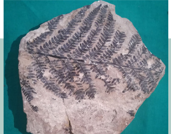
ინფორმაცია და ფოტომასალა მოგვანოდა ტყიბულის მხარეთმცოდნეობის მუზეუმმა.