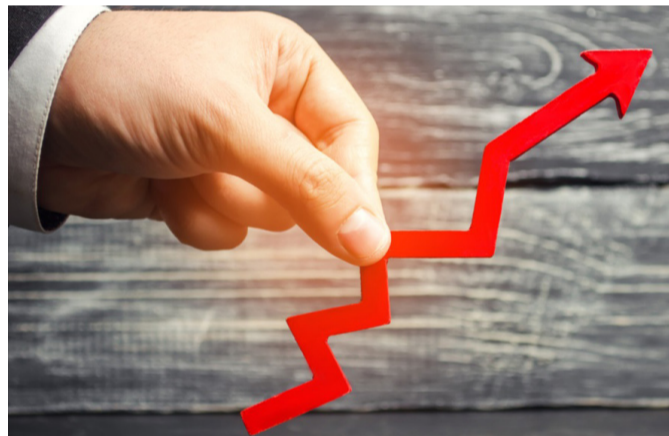
გაიზარდა, ცალკეულ ქვედანაყოფებზე კი ანაზღაურებამ 40%-მდე მოიმატა. მომპოვებელ, მზადებით

2020 წლის 1 სექტემბრიდან ხელფასები 20%-ით