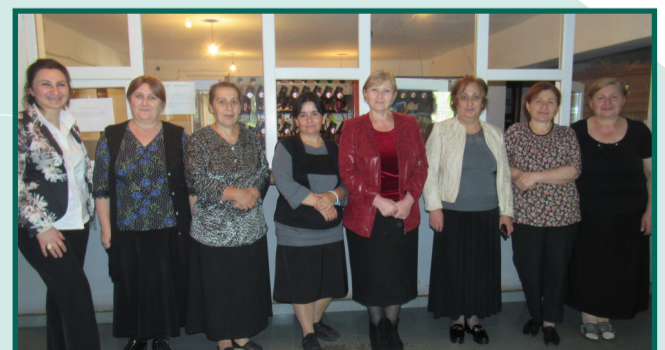
ქალბატონები პახტაში მუშაობის მრავალწლიანი გამოცდილებით