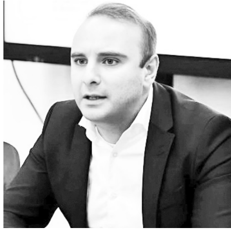
მნიშვნელოვანია ოკუპირებული ტერიტორიების დეოკუპაციის თვალსაზრისით?

ასიათასობით დაღუპული და დაჭრილი, მილიონობით ლტოლვილი, განადგურებული ქალაქები და სოფლები - ეს მცირედი ჩამონათვალია იმ სიბოროტისა, რასაც რუსეთი უკრაინაში ჩადის... ორი წელია, რუსეთ-უკრაინის ომი მიმდინარეობს და უკვე გარკვეული დასკვნის გაკეთება შეიძლება. უკრაინაში შეძლო არა მხოლოდ გამკლავებოდა რუსულ არმიას, არამედ შეძლო ოკუპირებული ტერიტორიების დაბრუნებაც. დასავლეთის დახმარება და უკრაინელთა თავგანწირვა რომ არა, კრემლი შეძლებდა მთავარი მიზნის (უკრაინის სრულ ოკუპაციას) მიღწევას. ისიც უნდა ითქვას, რომ ეს ომი შესაძლოა კიდევ რამდენიმე წელი მაინც გაგრძელდეს