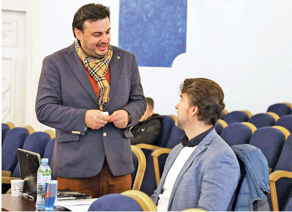
ფონდის დაარსებას მიესალმა ყველა, ვისაც კი შეხება აქვს ამ სფეროსთან. ქვემოთ გთავაზობთ ზოგიერთ გამომხატურებას.

აქვე აღვნიშნავთ, რომ კალე კანტილას აქვს სააგენტო, რომელიც 2012 წელს მიუნჰენსა (გერმანია) და ჰელსინკში (ფინეთი) ერთდროულად დაარსდა. იგი ერთ-ერთი უდიდესი და გავლენიანი სააგენტოა ევროპაში, რომელიც გერმანიის ყველა საოპერო თეატრთან თანამშრომლობს, ასევე, ისეთ მნიშვნელოვან საერთაშორისო საოპერო თეატრებთანაც, როგორებიცაა ლონდონის „კოვენტ გადენი“, სტოკჰოლმის სამეფო ოპერა, დანიის სამეფო ოპერა, გლინდბურნის ფესტივალი, მარინის თეატრი, მადრიდის სამეფო თეატრი, ბარსელონას გრან თეატრი „დელ ლიცეუ“ და ბევრი სხვა. აქტიურად თანამ-