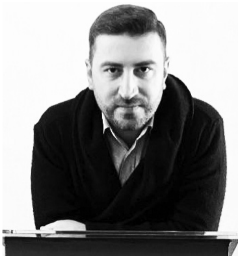
ლი გვაქვს ყრილობაც და ძირითად სამოქმედო გეგმებზე იქ ვისაუბრებთ.

2024 წლის საპარლამენტო არჩევნებამდე დაახლოებით 10 თვე დარჩა და პოლიტიკურმა პარტიებმა უკვე დაიწყეს შიდა სივრცეში, არაოფიციალურად, არჩევნებისთვის მზადება. მმართველ გუნდში მარცხს გამოიცილებენ, მეტიც, ამბობენ, რომ ყოველგვარი საარჩევნო კამპანიის გარეშე „ქართული ოცნება“ უპრობლემოდ აიღებს 60%-ს, ოპოზიციაში კი აცხადებენ, რომ პირიქით, „ოცნება“ ძალიან დაბალ პროცენტს აიღებს და 2024 „ქართული ოცნების“ ხელისუფლების დასრულების წელი იქნება. ოპოზიციურ პარტიებს ახლად შექმნილი პარტიებიც შეემატება, რომლებიც გამარჯვებისთვის იბრძობებიან.