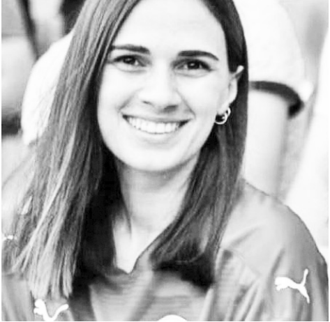
მიწვევითა ქალ ფეხბურთელთა გულშემატკივრობა.