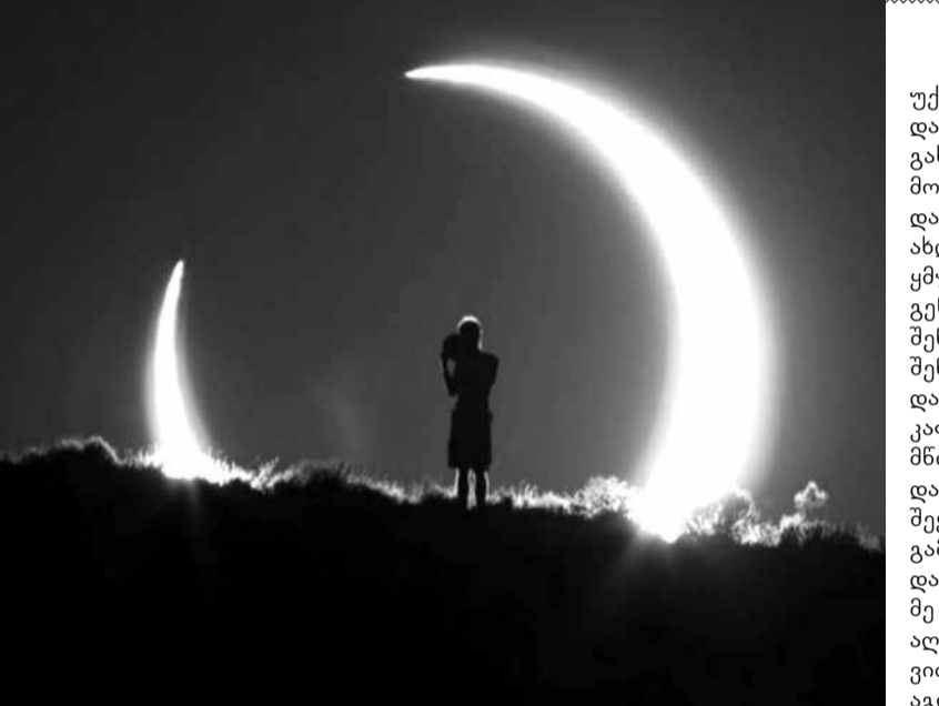
ტურისტმა თავი ჩამოიხრჩო თერთმეტ იარღში, მე უცხოელნი მაფიქრებენ მრავალ განცდაზე, კვლავ ვიკეტები მარად ღია გულის წყვდიადში და ბნელ იალქნებს შევცქერივარ მაინის ცაზე.

მაინი იკლავს მარადიულ წყურვილს დინებით, ვცდილობ თან ავეყე ამ დიდებულ მოძრავ პეიზაჟს, ქალაქი თითქოს მემუქრება ბნელი ბინებით, და ემსგავსება გამოპრანჭულს, როგორც გეიშას.