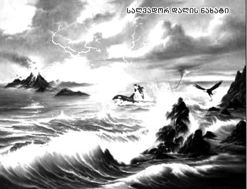
სალგვდორ დალის ნახატი

მამშივდება შენთან ეს სიახლოვე: მზე იკრიფება, როგორც მაღლარი, ცა სულის უფრო სამოსახლოა, ვიდრე ცისფერი ნამოსახლარი,