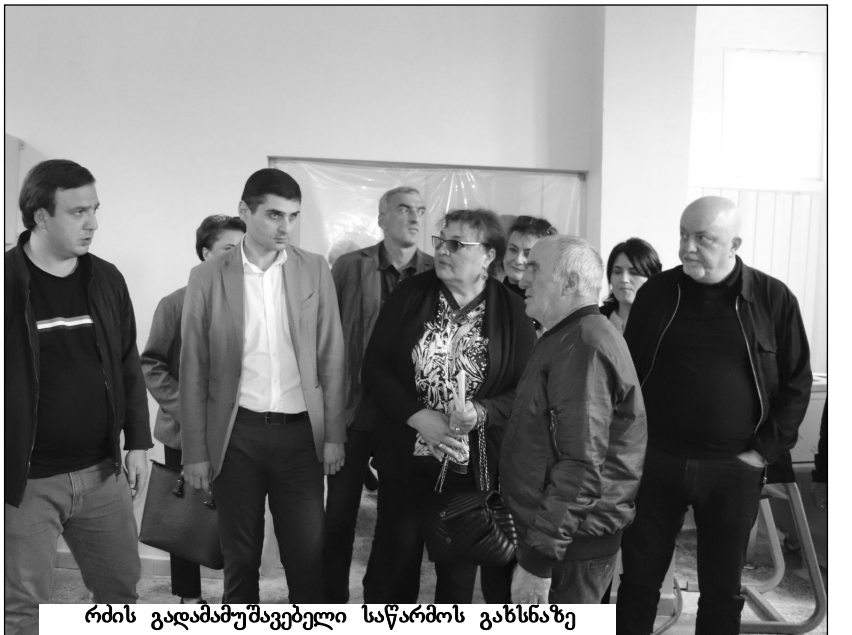
რძის გადამამუშავებელი საწარმოს გახსნაზე