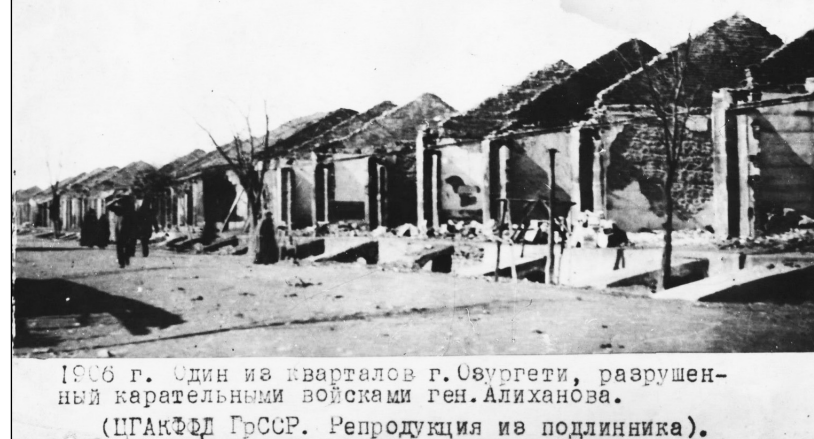
1906 წ. Один из кварталов г. Озургети, разрушенный карательными войсками ген. Алиханова. (ЦГАКФДГ ГрССР. Репродукция из подлинника).

გურიის სოფლების დაწილების ფაქტები აღწერილია „მოგზაურის“ ფურცლებზე ასე მაგალითად: „სოფ. ხვარბეთი. 25 მარტს ჩვენს სოფელს ყაზახ-რუსებმა ალაგ შემოარტყეს. სოფლიდან გამოძვლის ნებას არავის აძლედნენ. რამდენიმე მოსახლე კაცი გაჩნდნენ და ბერი დავითურს დავითურს შერმან ვიბრანიძე , რომელსაც რევოლუციური და „ბერძენა“ უნახეს, ორივე არა-აი, რა თქმ უნდა, წაართვეს, მორე დღეს ვიბრანიძე მარგალიტზე დაიჭირეს, დაიჭირეს ასევე არსენ კვცამიძე, რომელსაც ოზურგეთში აყვამოფეო მაჰყვად ექმან. დავითურს აგრეთვე ერთი ყმწველი ალექსი ვიბრანიძე და იჭირეს, ამს უსათუოდ ვიბრანიძე ვერცხენდა. ამთ ვარდა, ბერი გაჩნდნენ ჩვენ სოფელში, მარ დავითურს არავინ დაუჭერათ. 26 მარტს ძალით მიხედეს მურვანიძის ღვინო სვეტ ქური, თუმცა ავითაქარს, პროვიზორს ფინა ძღველი მოპარეს და როცა ამან ალიხანოვთან იჩივლა, უკანასკნელმა ასეთი „უაზრო“ საფრისათვის ერთი კვირით ციხეში კვლობ