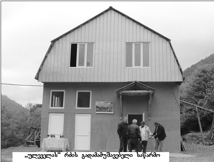
„ულეველას“ რძის გადამამუშავებელი საწარმო

2014 წელს ზოტში ჩამოყალიბდა კოოპერატივი „ულეველა“, რომელში 40 მეზაიე ოჯახი გაერთიანდა. კოპერატივმა ათთვისა მაღალმთიანი რეგიონისთვის განკუთვნილი ორი სახელმწიფო პროგრამა, ხოლო გასული წლის გაზაფხულზე გაიხსნა ვეროსტანდარტების და ჰასპის პროგრამის სტანდარტების დაცვით რძის გადამამუშავებელი საწარმო, რომელმაც პირველი პროდუქციაც გამოუშვა. საწარმოს გახსნას გურიის გუბერნატორი გიორგი ურუშაძე, ჩონატაურის მუნიციპალიტეტის მერი დავით შარაშიძე, საინფორმაციო-საკონ-