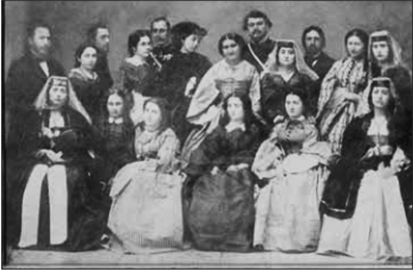
დედაჩემს ვერაფერს გამოაპარებ, დღეს გურიაში გამოგზავრებამდე მივინახულა, გულთაძი მიხალმების, ჩახუტების და ლოყაზე კოცნის შემდგომ, მეუბნება:

გო, მართლა ასეა, თუ მეჩვენება, რაღაც-რაღაცეებს იმეორებ წერილებშიო. ასეა, — ვუბნები მე. — არ გამოდის სხვაანაირად. დამოუკიდებელ წერილებს ვწერ და ზოგჯერ თხრობის ლოგიკა ასე ითხოვს. არ მიყვარს, მკითხველის ამ ნომრიდან, იმ ნომერში გადამისამართება.