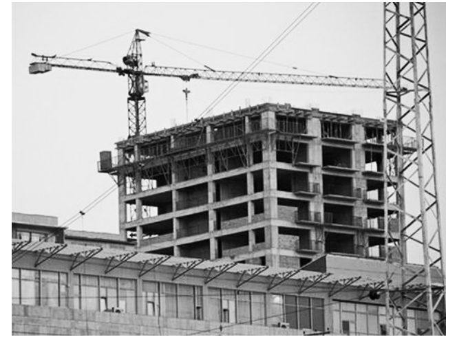
конного строительства в зонах охраны культурного наследия и введение своеобразного превентивного механизма", - заявил Каладзе.

"Хочу еще раз напомнить нашему населению, что цель принятия этого закона - максимальное предотвращение неза-