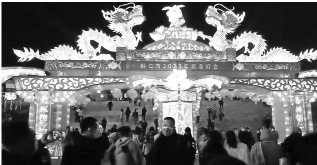
со стороны йеменских повстанцев на коммерческие суда.

Это означает вероятную задержку поставок продуктов, которые должны поступить на полки магазинов в западных странах в апреле или мае, что может вызвать острый дефицит товаров в краткосрочной перспективе. Сокращение глобальных грузоперевозок через Красное море может спровоцировать новую волну инфляции в мире, так как поставки товаров по альтернативным путям обходятся грузоотправителям значительно дороже. Так, согласно отчету агентства Clarksons Research, число контейнеровозов, следующих транзитом через Красное море в сторону Суэцкого канала, за первую неделю января упало на 90% по сравнению с аналогичным периодом прошлого года из-за опасений по поводу нападений