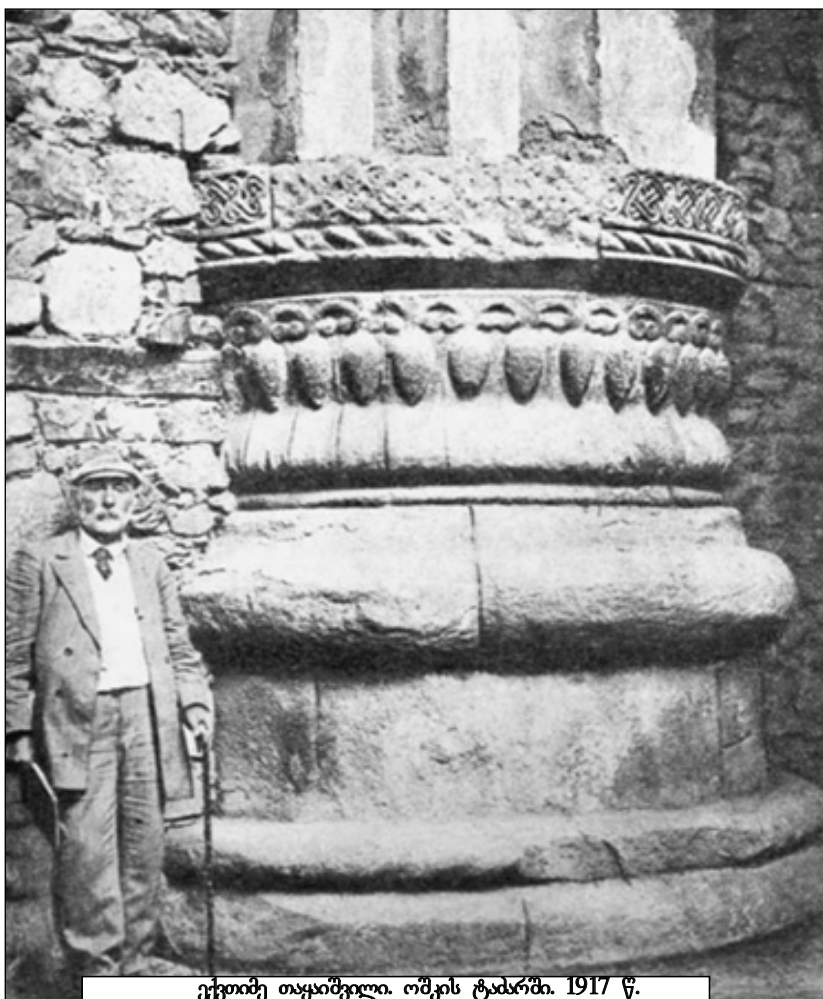
ექვთიმე თაყაიშვილი. ოშკის ტაძარში. 1917 წ.