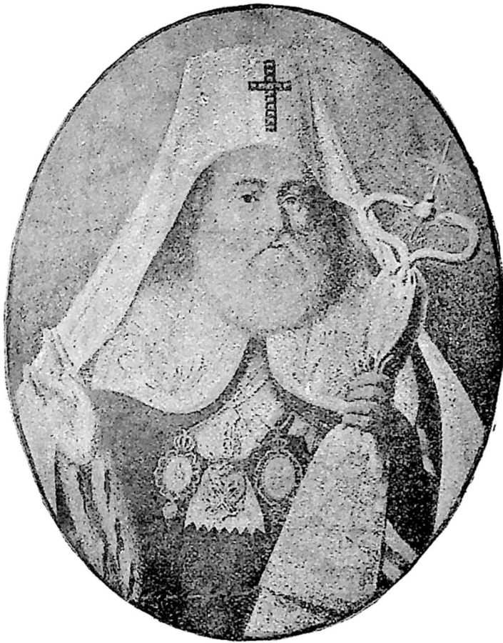
ანტონ კათოლიკოზი II.

ქე ირაკლი მეფისა, დაიბადა 1765 წელს, ამის გამგეობით გათავდა კათალიკოზობა საქართველოში, 1812 წელს გადასახლდა რუსეთს, იქ მიტროპოლიტობა და პატრიფი მისცეს.