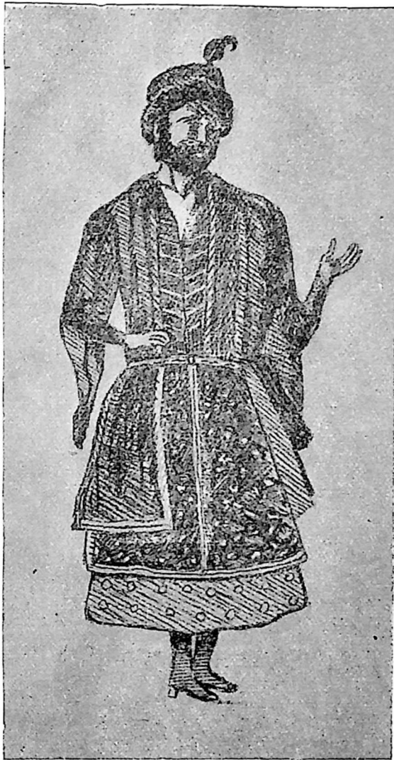
დავით მეფე კახეთისა.

თათრობაში იშამეული ხანი. გონიერი მეფე გულშემატკივარი გამგე. შწიგნობარი, დიდი შო- საჩხლე ქართველობისა. გორგიჯანძე ისტორიაში ამ სიტყვებს ამბობს ამ მეფეზედ: „ღმერთო ხელი მოუმართე კახ ბატონს და კახეთი დღეგრძელობასა და გამარჯვებაში ახმარე“. გარდ. XVIII ს. პირველ წლებში.