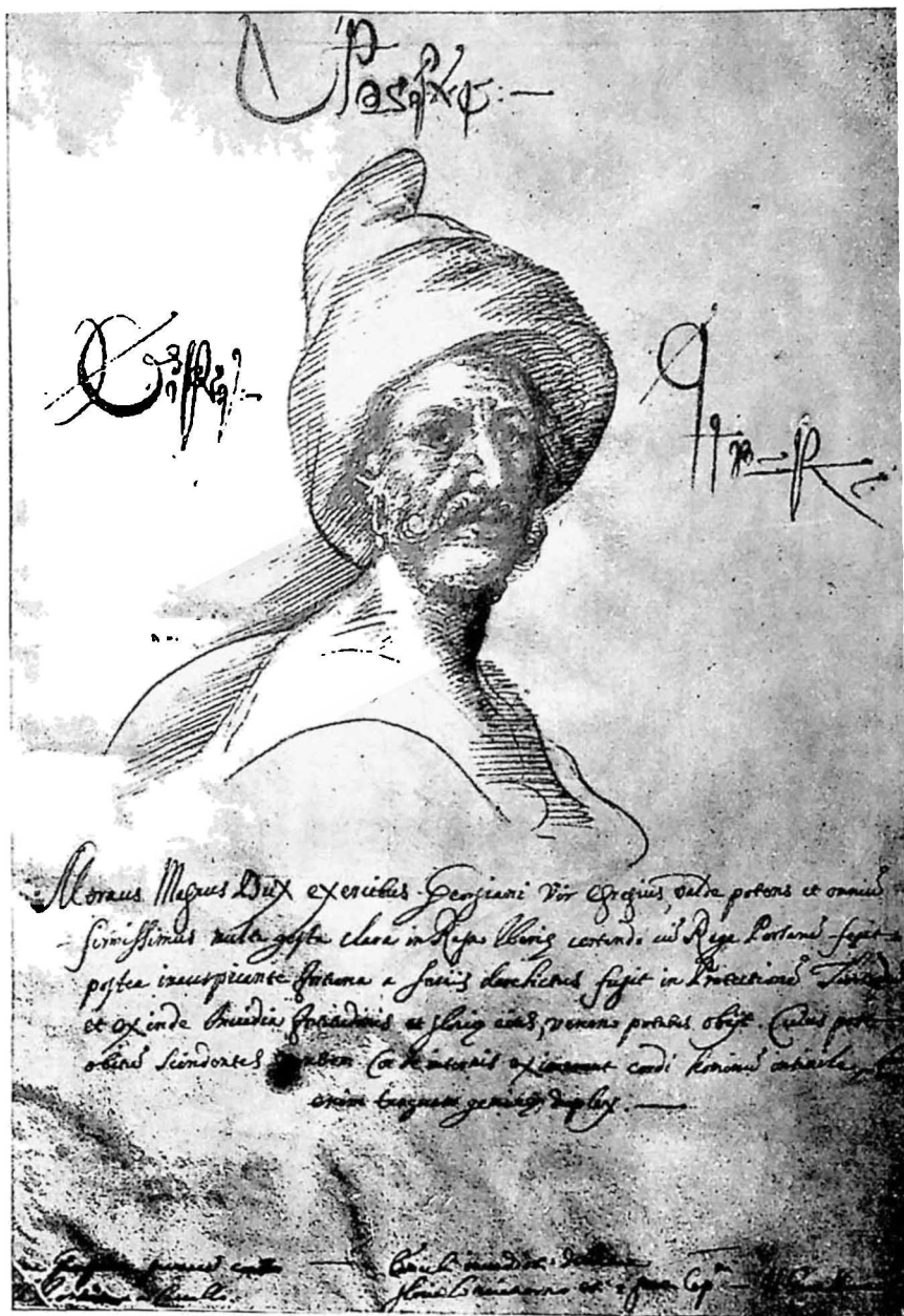
დიდი მორავი გიორგი სააკაძე.

ცოლის ძმა ლუარსაბ მეფისა, ცნობილი ჰირი, აშას ამბებო ნახეთ წიგნში.