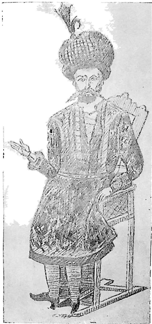
ირაკლი მეფე I.

თათრობაში ნაზარ აღიხანი. ჩუმი ქრისტიანი, დიდი მოჭირნახელე ქართლ-კახეთის გაძლიერე- ბისათვის. სპარსეთ-ოსმალეთთან კარგად უჭირა საქმე.