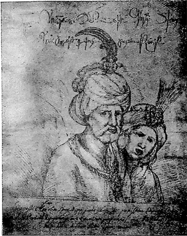
მეფე თეიმურაზ I მეულლით.

ეს არის მეორე გმირი იმ უბედურებისა, რაც კახეთს ეწვია 60 ათასი კომლის გადასახლებით ქართლის ამოკლეტა-ამოწვევით შაჰაბაზისაგან. დაიბადა 1595 წ. გარდაიცვალა 1663 წ. იყო მწიგნობარი, სწერდა ლექსებს.