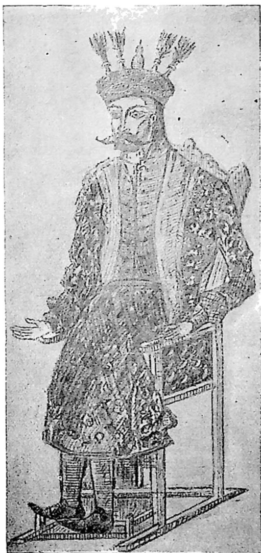
მეფე ვახტანგ V.