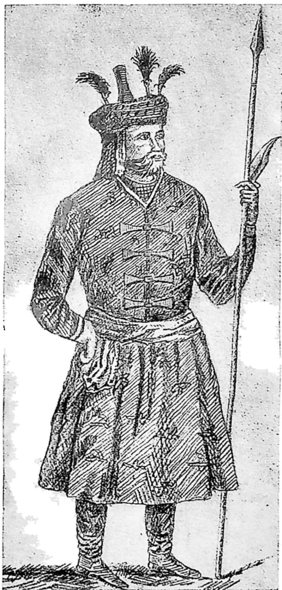
მეფე ალექსანდრე კახეთისა.

იყო გონიერი კაცი. ერთ დროს გათათრდა, ალექსანდრე რუსეთთან კავშირის გამო მოკლულ იქმნა შაჰაბაზის ბოროტებით.