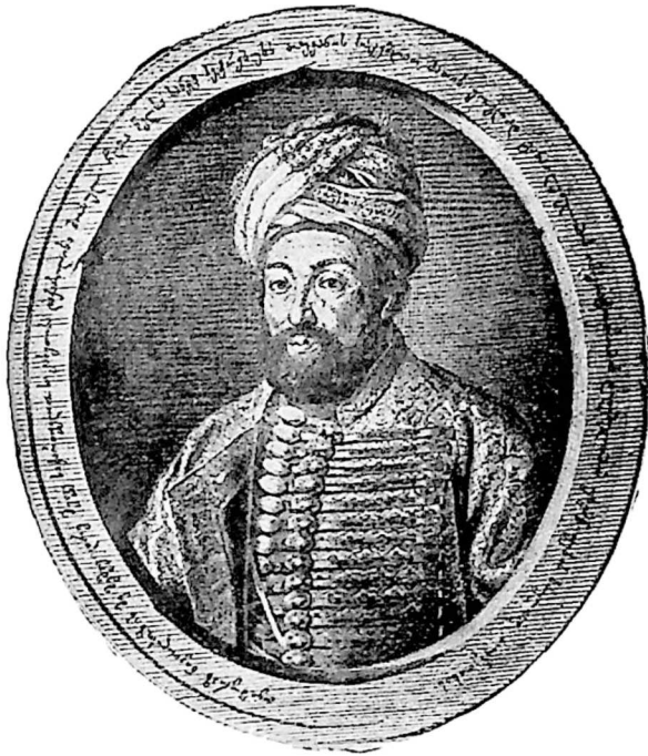
თეიმურაზ მეფე კახეთისა.

მამა ერეკლე მეფისა; კადასახლდა რუსეთში, კახეთის გამგეობა თავის შვილს ირაკლის კადასცა, ამით ისარგებლა ირაკლიმ და ქართლ-კახეთი შეაერთა. სიმონ მე- ფის შემდეგ, პირველად თეიმურა- ზი დაგვირგვინდა ცხეთაში ქრისტინულს წესითა. თეი- მურაზი რუსეთში გარ- დაიცვალა 1764 წელს.