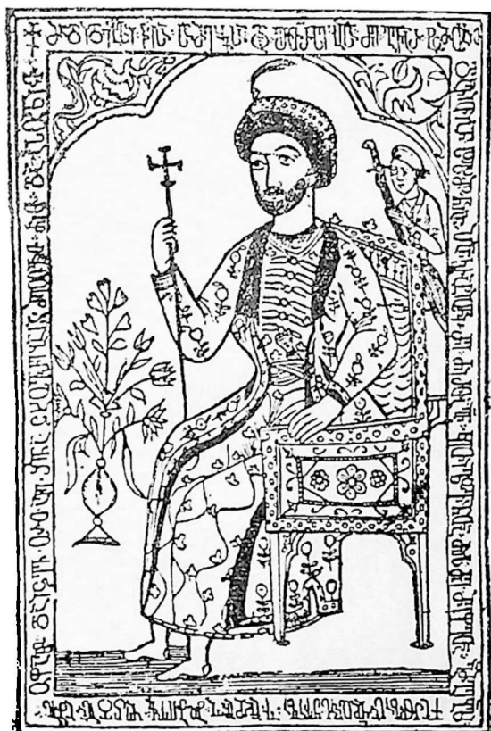
ვახტანგ მეფე VI.

თათრობაში წოდებული ჭუსეინ ეული ხანად. სპარსეთში ეოფნის დროს, კათოლიკის ბე- რებთან საიდუმლოდ ქრისტიანობას აღიარებდა. იყო გონიერი გამგე, ისლამი დასტოვა, რომში და სატურანგეთში საბა ორბელიანი გაგზავნა, ლუდოიკს და ჰაჰს შველას სთხოვდა, მერე რუსეთს მიმართა, გა- დასახლდა, ასტრახანს გარდაიცვალა 1737 წელს. ტფილის- ში, ჰირველად ქართული სტამბა ამან გახსნა 1708 წელში.