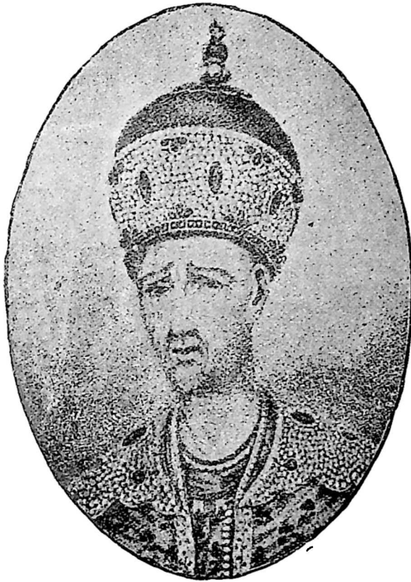
ყაჯარი ალა მამალხანი.

საჭურისი, დაუძინებელი მტერი ერეკლე მეფისა. 1795 წ. ქურღულაღ დაეცა თფილისს და აღაოხრა, 1797 წ. მეორედ მოდიოდა ასაკლებად, გზაში მოკლა მისმა მსახურ მცხეთელ ანდრიაშ, თათრობაში სადისა. ერეკლეს უთვლიდა: რუსებს ნუ ეკედლებიო. ერეკლეს ჰასუხი: მამ თქვენ დაგვანებეთ თავი და ქვეყანას ნუ გვირბევთო.