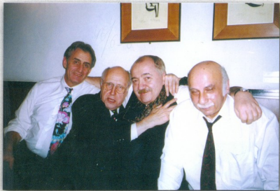
გიორგი ალექსი - მესხიშვილი მსტისლავ როსტროპოვიჩი რობერტ სტურუა გია ყანჩელი