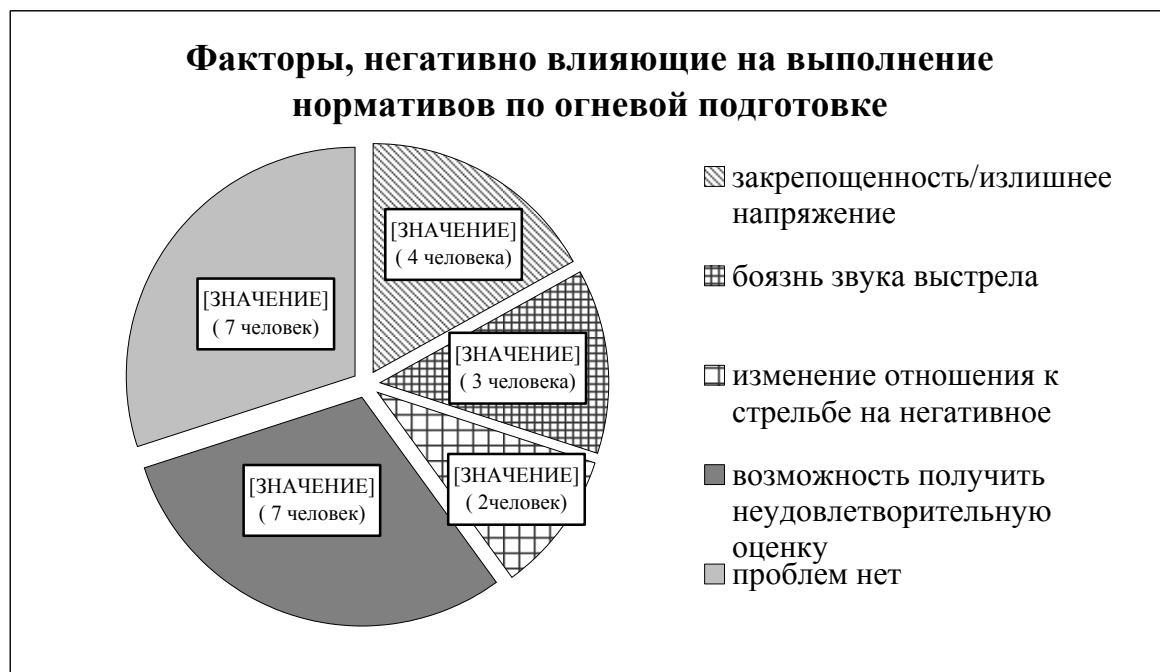
Рис. 2. Факторы, негативно влияющие на выполнение нормативов по огневой подготовке

дание выстрела», что в свою очередь негативно сказывается на результатах стрельбы.