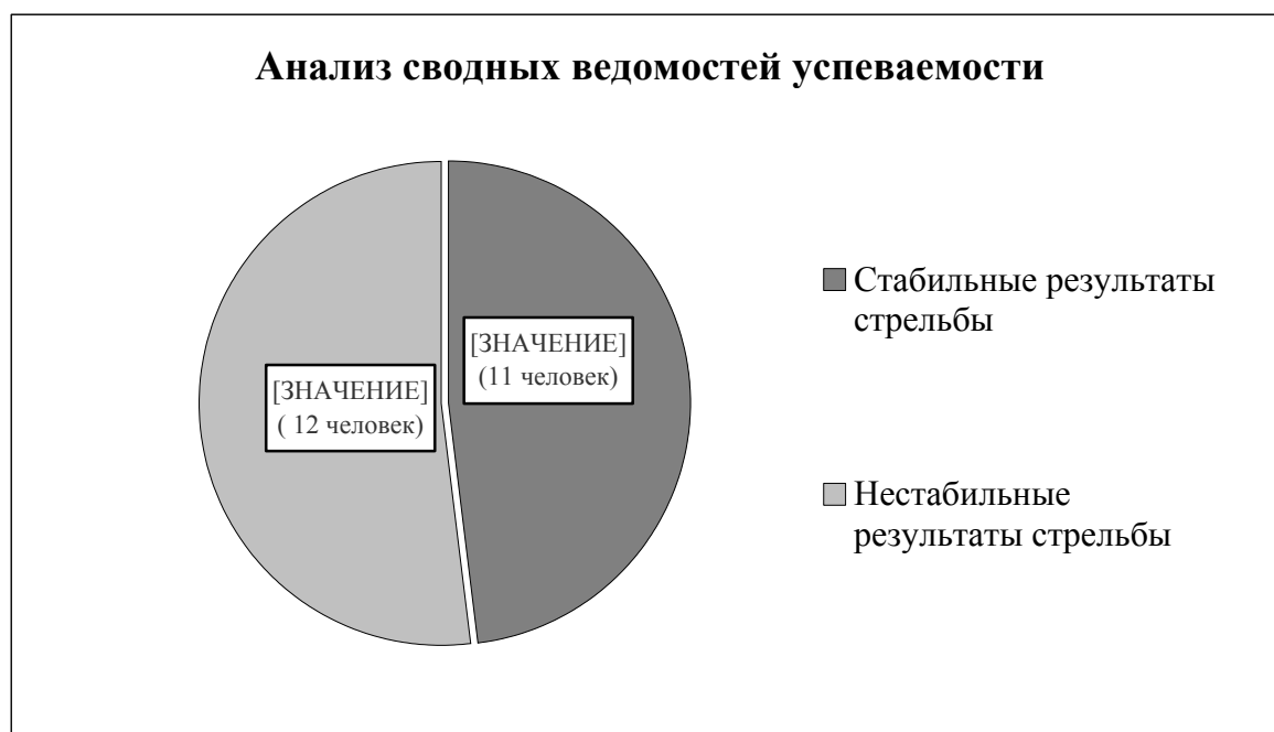
Рис. 1. Количественный и процентный состав курсантов по критерию успеваемости

На первом этапе исследования нами был проведен анализ сводных ведомостей успеваемости за учебный год, что позволило выявить следующие уровни результатов стрельбы (см. рисунок 1):