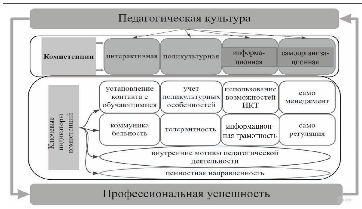
Рис. 1. Логическая структура курса «Современные требования к профессиональной компетентности преподавателя высшей школы»

мационном поле с использованием цифровых технологий и, соответственно, преподавателю необходимо быть информационно грамотным, владеть цифровыми умениями и навыками, уметь анализировать, структурировать и преподносить информацию, влиять на восприятие информации обучающимися. Кроме этого, полифункциональность деятельности современного преподавателя, ее информационная и социальная насыщенность, наличие формализованной части деятельности требуют высокого уровня самоорганизации, знания себя, своих сильных и слабых сторон как профессионала, владения навыками самоменеджмента, построения индивидуальных маршрутов профессионального развития. Наличие развитой профессиональной культуры, высокого уровня профессиональной успешности и сформированности ведущих профессиональных компетенций обуславливают высокий уровень готовности преподавателя высшей школы к осуществлению педагогической деятельности.