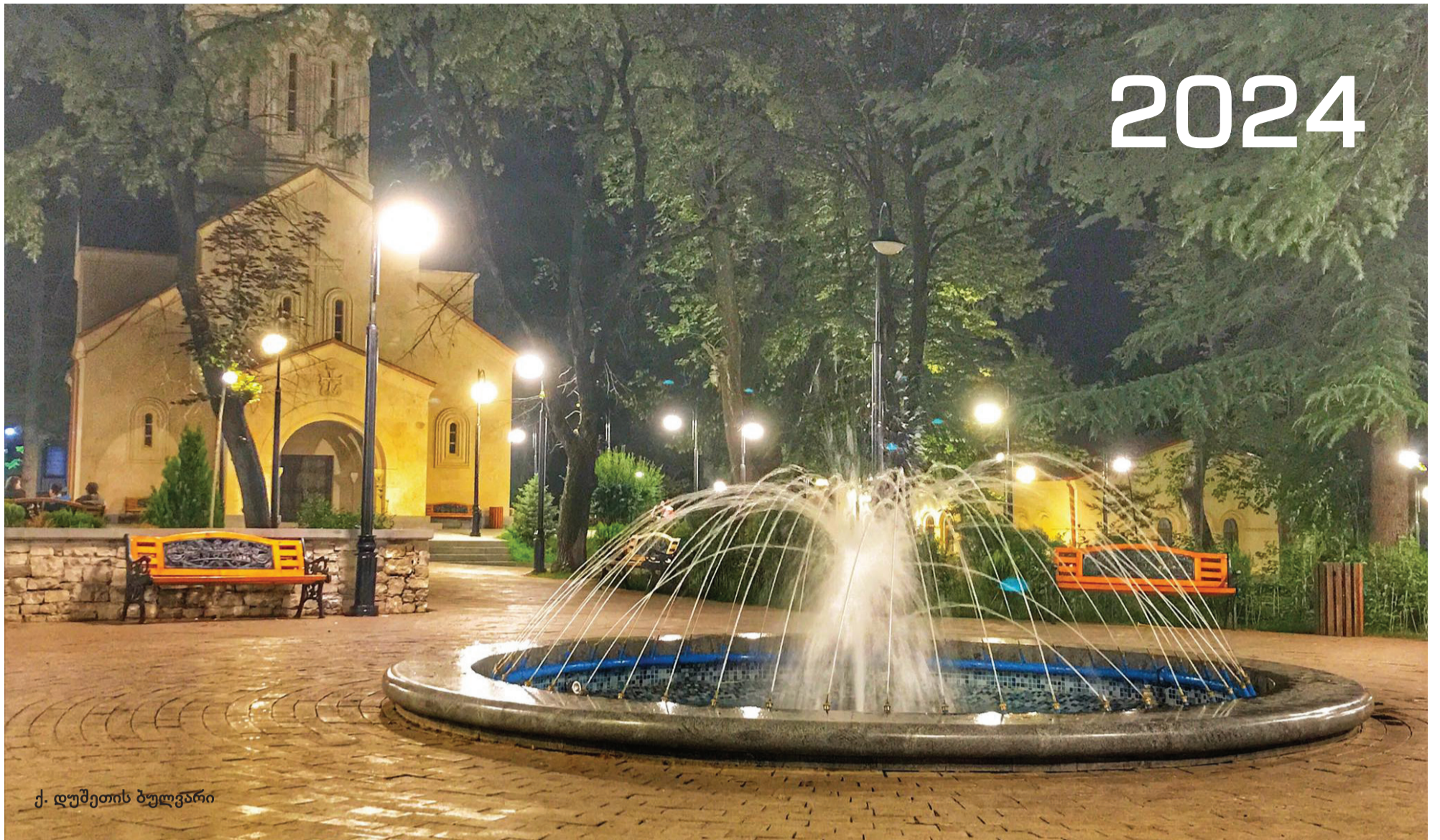
ქ. ღუბეთის ბულვარი