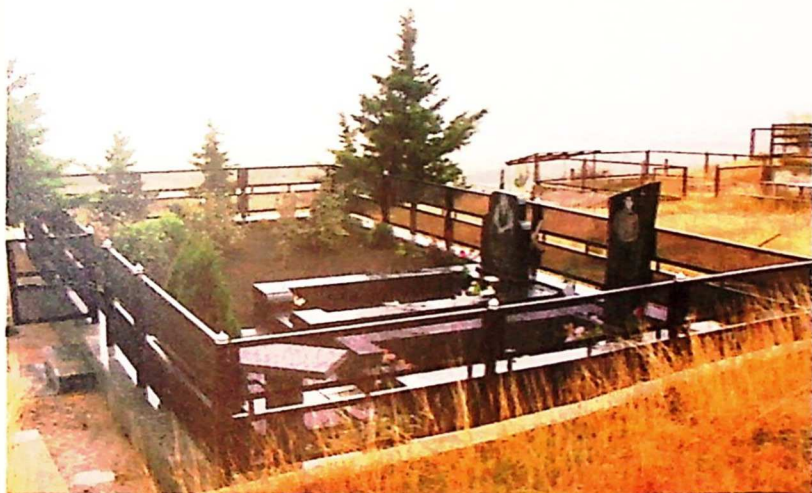
მარტყოფი. აპარნის სასაფლაო