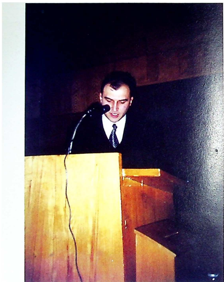
დისერტაციის დაცვა. 1998 წ.