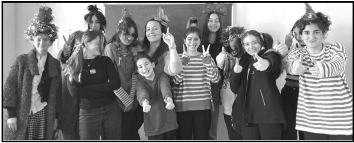
ამ გარემოში იზალება.

მოსწავლეების მიერ, სათემო ორგანიზაციის მხარდაჭერით, წამოწყებული კამპანია, ევროპა უკეთესი მდგრადი განვითარებისათვის!