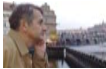
კობა ლიკლიაძის ბლოგი; რადიო „თავისუფლება“ radiotavisufleba.ge

18 მარტს საქართველოს ყოფილი პრემიერ-მინისტრმა და არასამთავრობო ორგანიზაცია „მოქალაქის“ დამფუძნებელმა ბიძინა ივანიშვილმა საქართველოს მოსახლეობას ორი მნიშვნელოვანი ამბავი აუწყა: ერთი უსიამოვნო და მეორე — სასიამოვნო.