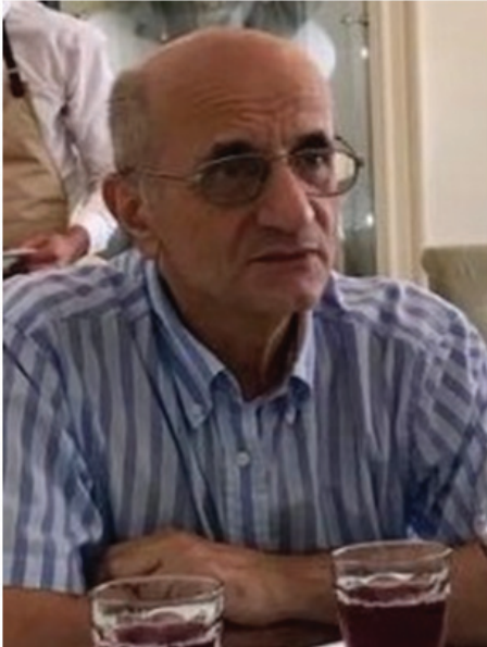
1. ბრძოლა პოეტის სულში

შილერი ლაპარაკობდა ეგრეთ წოდებულ ნაიფურ და სენტიმენტალურ პოეზიათა შესახებ. გულისხმობდა იმ განსხვავებას, რომელიც შენიშნა ძველი მსოფლიოსა და ქრისტიანული კულტურის პოეტთა შორის. ნაიფური ანუ გულუბრყვილოა პოეზია, როცა ავტორი მთლიანად ერწყმის ნაწარმოებს. სხვაგვარადაც შეიძლება ვთქვათ: ავტორი მხოლოდ ხატავს და არ ჩანს თვით მისეული შეფასება. სენტიმენტალური ანუ გრძნობამორეულია პოეზია, როცა ავტორი მაღლა დგას თავის ნაწარმოებზე. აქ მთავარია თვით მისი პიროვნება და მოვლენების მისეული შეფასება. თუ ამ საზომს მოვიმარჯვებთ, ქართულ მწერლობაში „სენტიმენტალური“ პოეზიის ტიპური ნიმუში იქნება, ვთქვათ, ბარათაშვილი, ხოლო „ნაიფურისა“ – აკაკი, მეტადრე კი – ვაჟა-ფშაველა. მის თხზულებებში მთავარია, თუ როგორია თვით ბუნება. ნაკლებად მნიშვნელოვანია, თუ რა ერჩია პოეტს; როგორ შეაფასებდა ის იმას, რაც არის. ეს აძნელებს ვაჟას მსოფლმხედველობის მკაფიოდ გამოკვეტას. მართლაც, მსოფლმხედველობაში