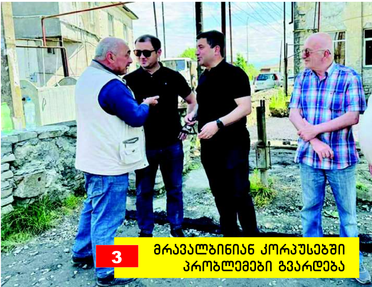
3 მრავალბინიან კორპუსებში პრობლემები გვარდება

სახალხო დამცველის აპარატის წარმომადგენლები სამტრედიისში უბრი დისკრიმინაციას