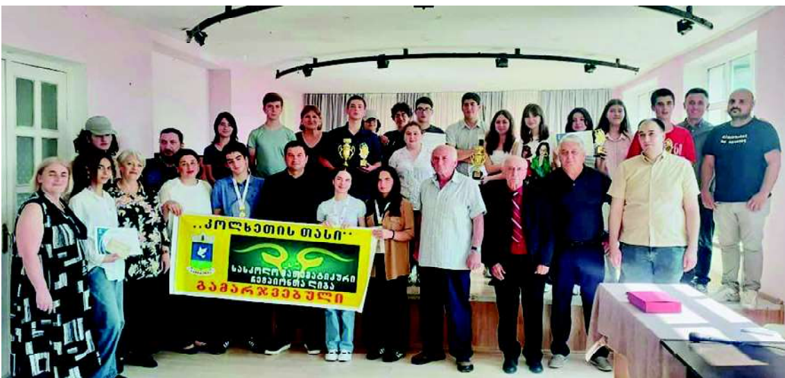
“კოლხეთის თასის” გამარჯვებული მეთერთმეტი საჯარო სკოლა

პროექტი საქართველოს 20 ქალაქის 30 საჯარო სკოლაში განხორციელდება