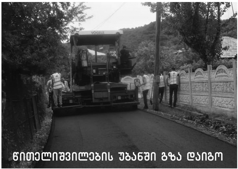
წითელივკილავის უბანში გზა დაიგო