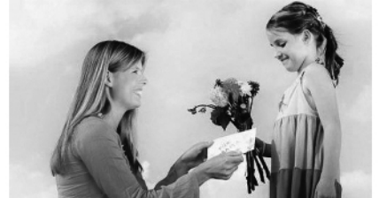
სართოდე აქრომინობი რომ გამორეხებს.

მინდობისინებს გაცხადებულს ამ დობის დედასეხლებს, ვახსის ნუჯიარ ვამბობთი. წაუცე ვიქცემბეს პირეტი და სარეოლომინი ვიქცემბეს ქალბატონების დევის დედა, მამრეს ქალთა სარეოლომინის სოდელომინის დედა, მამრეს.