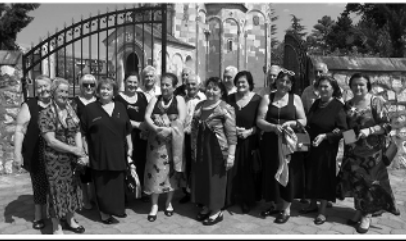
მშენებლის მინერეო ღინან აპოთეპო

შოღლის თავი შოქვიეროუ ხახანკერო დარბაზში. დარბაზი "ფანტაზია" იყო წყნს მახინიქ დო. იყო მინკერება, შოქვიერება, სიჯერეული თურქუ შოქვიანკერება კრინინიოთ. ეს დღე წყნს ცხოვრებაში ხასიანოქო. უღამაშეს დღედ დარჩება. მადლობა "ფანტაზიის" თანამ-შრომეღს ყურადღებხასიოქს. მადლობა ხერეო კრავიქშიღის შუგობრებს, რამას გვეღის, კოქე ვინბადებს რომლებმაც მუხიკით გავეცდამასეს ხადღო. მადლობა შუხვდრის ორგანი-სოატორებს, ხერეო კრავიქშიღს, რუსუღან მადღეკვდიქს, ვიფიქოთერატორს თერეო ხ სურ-ცდღავს. შინდა, ყვეღა კლასესს ყუხურეო ვანჩინოღობის და დიდხანს სიჯერხედე შოხვდელ შუხვდრებმდე შუგობრები!