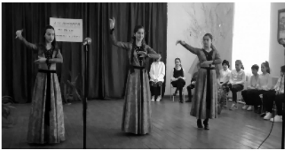
ნატო გაბმური და მშობლები კურბანჯა გოთონას დაწვევით მონაწილეობენ.

მეცხოობას, სვეტცხოველობას და მონაწილობას მოცხდენა ხალოცად შეკრული მხატვრულ-დისტრატურული, მუსიკალურ-ისტორიული კომპოზიცია. ზღმდსწყენითი ხისუხტით გეამოცხაურეს პატარებმა საქართველოს სისხლით ნაწრის ისტორიის დაბორინებში. გმირი წინაპრები, ურხის და მამულის, სარწმუნოებისათვის თაღდიებული მყეფედდებულთა დეაწლის შესხეზბაც ისაუბრეს და დამასხი, დონისძეთის თამატიკაზე